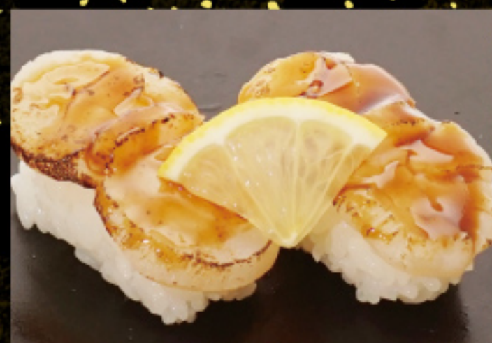
炙りほたてレモン 390