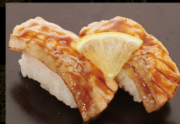
炙りサーモンたれ 390