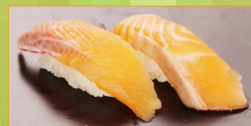
しそりサーモンとサーモン食べ比べ