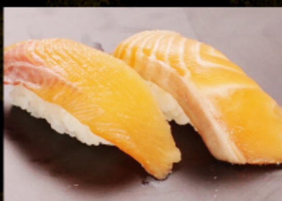
実栗サーモンとサーモン 390