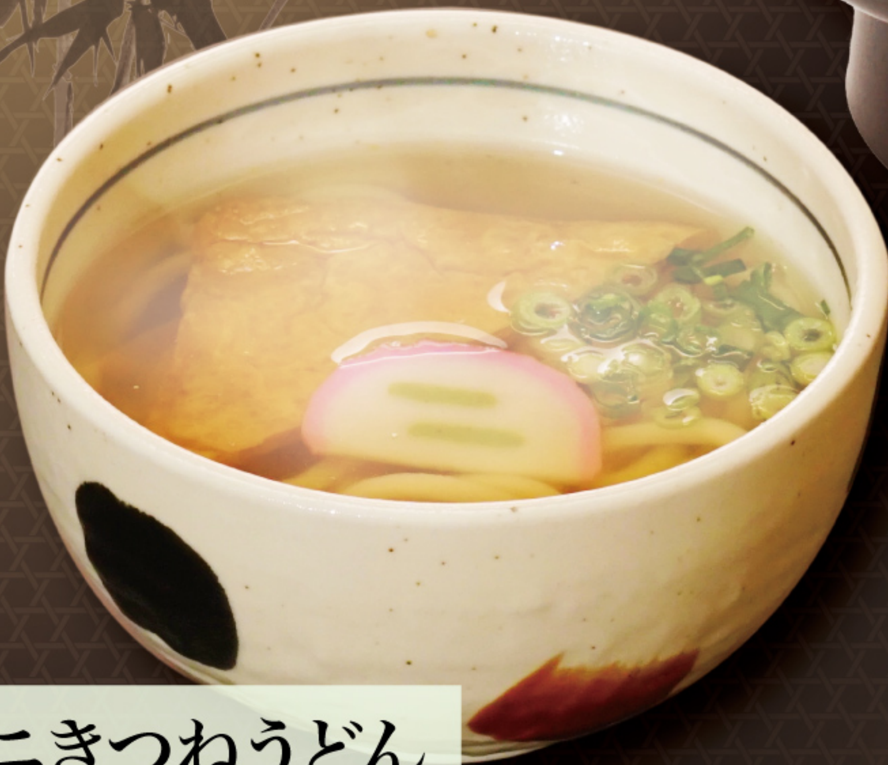
ミニきつねうどん 370円