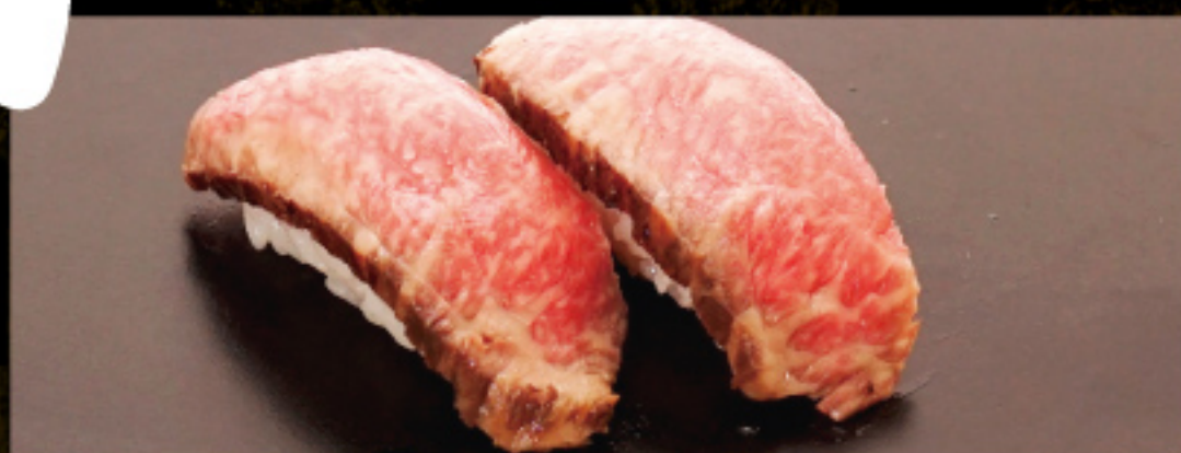
国産牛のローストビーフ 490