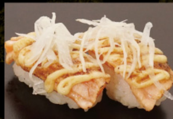
炙りサーモンマヨ 390