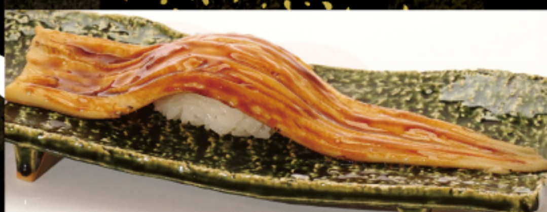
煮あなご一本勝負 590