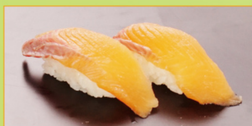
生しそりサーモン