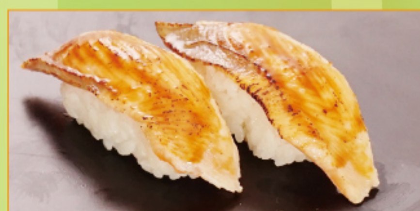
炙りしそりサーモン