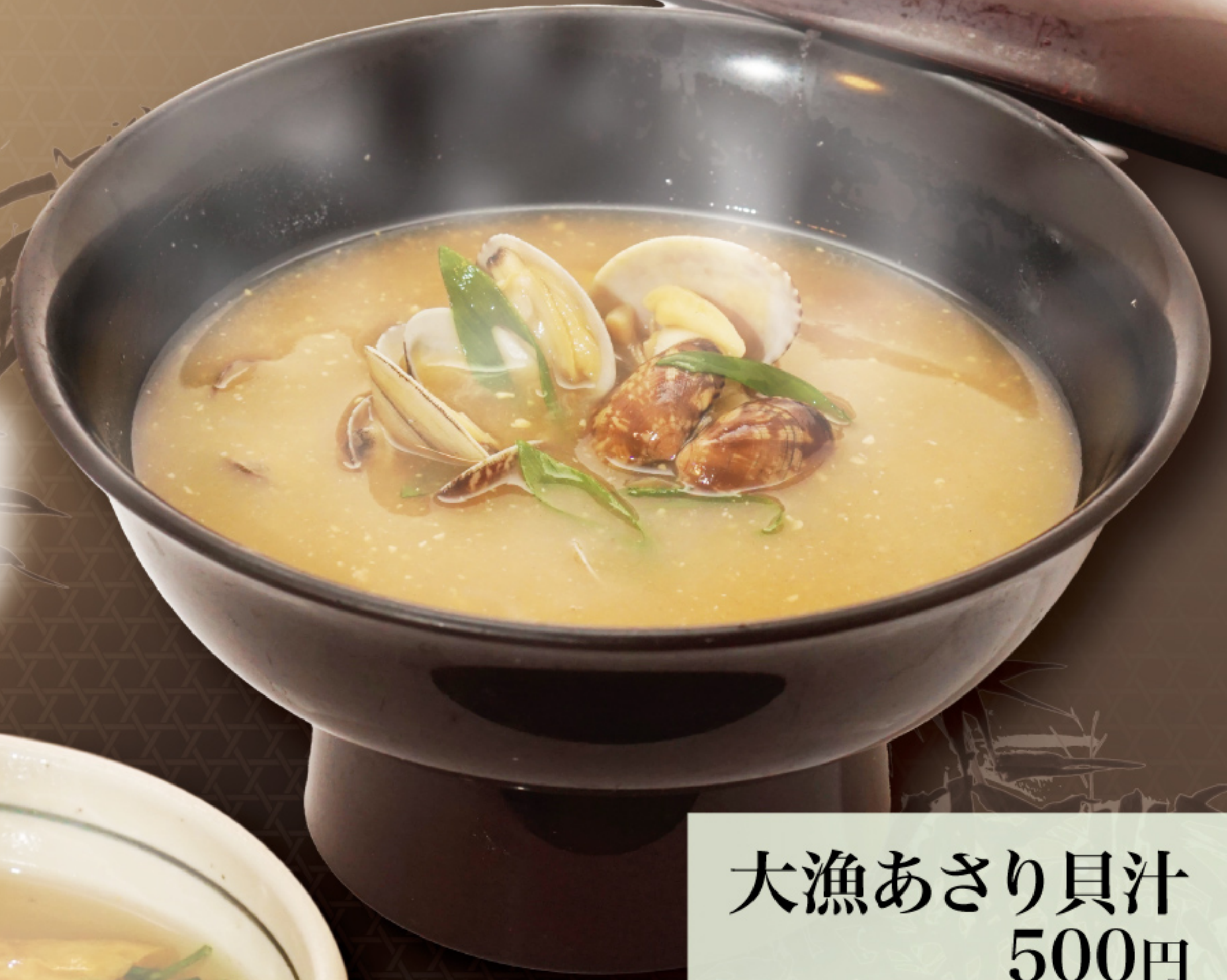
大漁あさり貝汁 500円