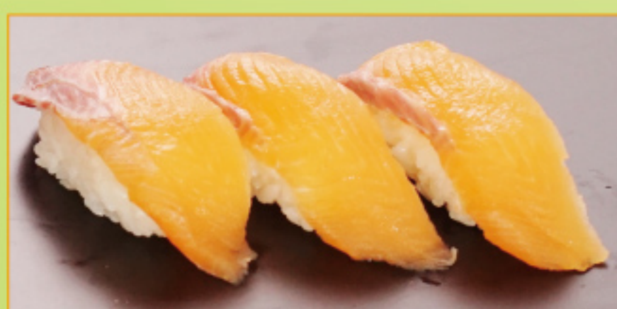
しそりサーモン三味