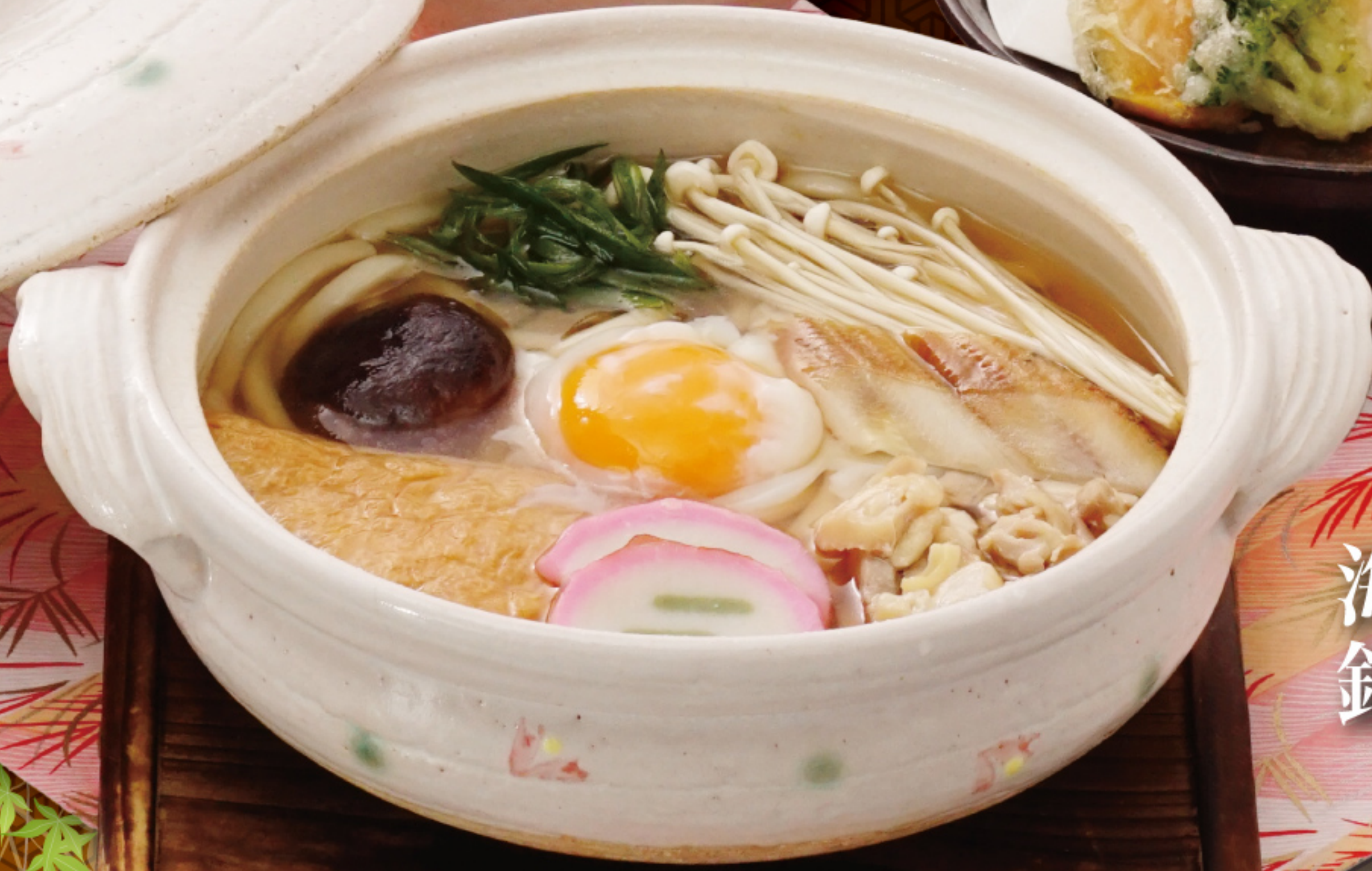
海老天 鍋焼きうどん(そば) 1,200円