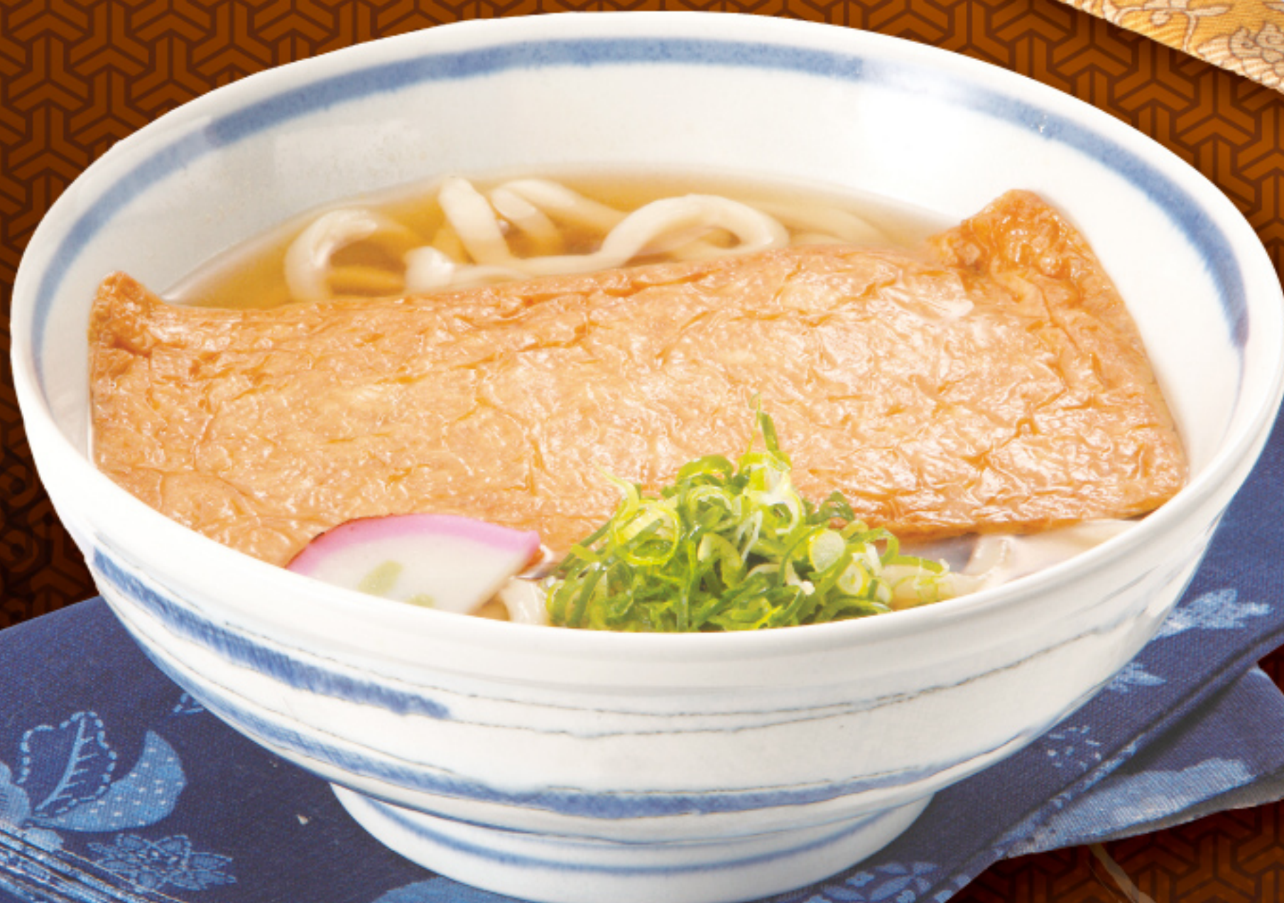
きつねうどん (たぬきそば) 650円