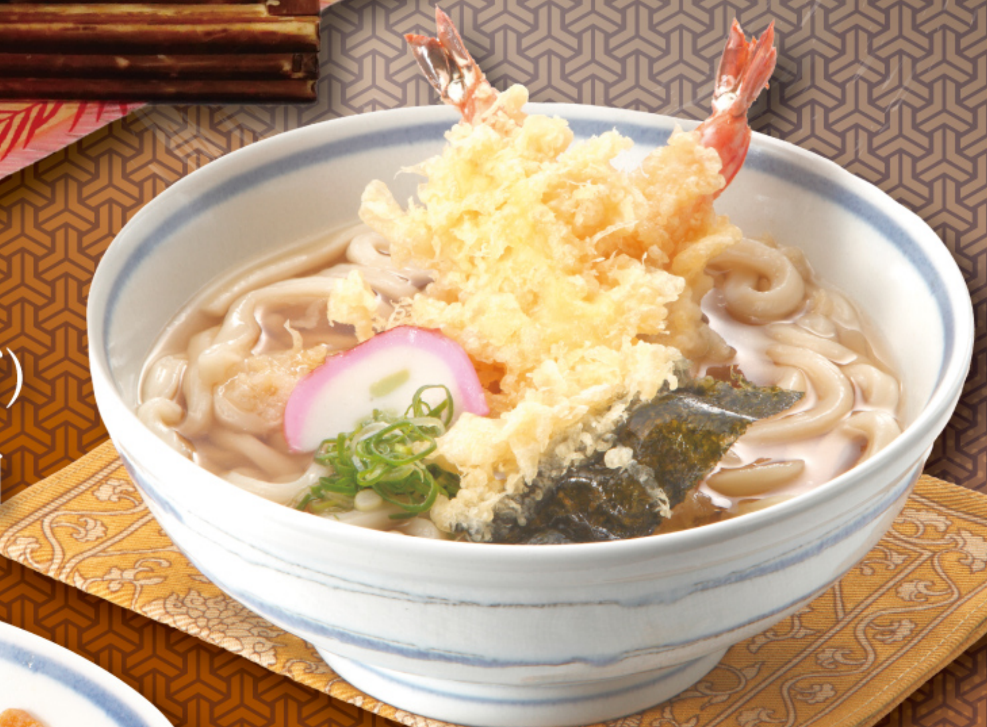
天ぷらうどん(そば) 850円