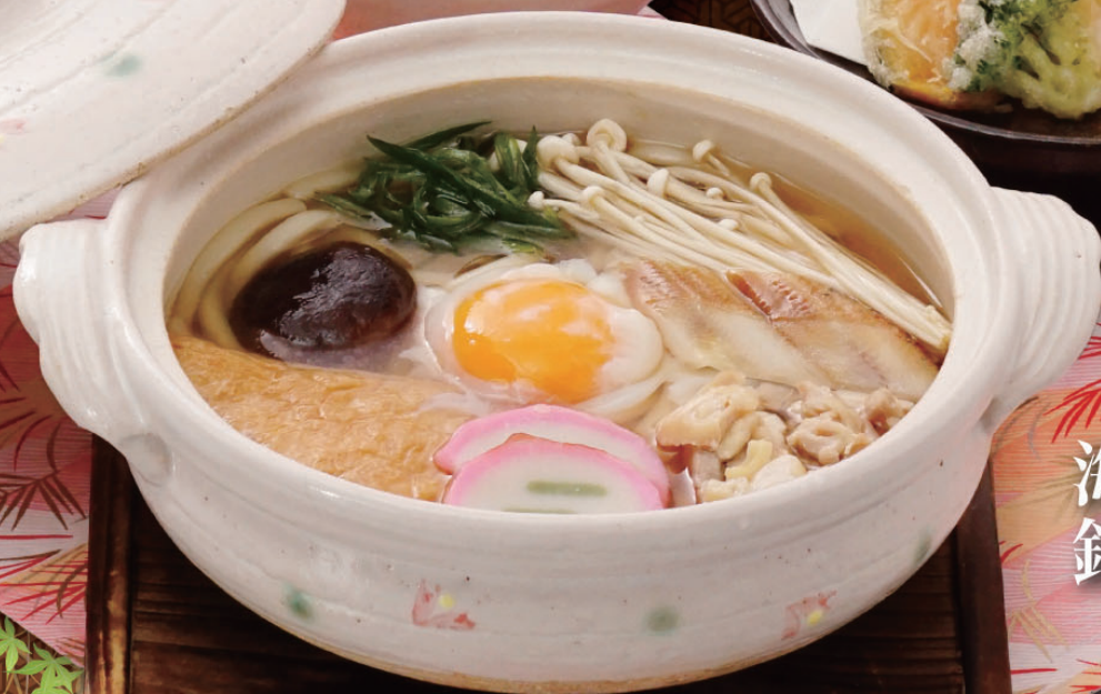
海老天 鍋焼きうどん(そば) 1,150円