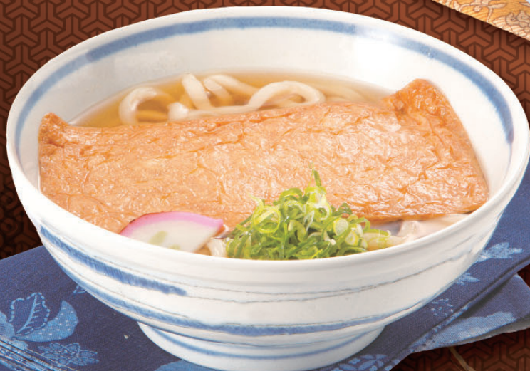
きつねうどん (たぬきそば) 630円