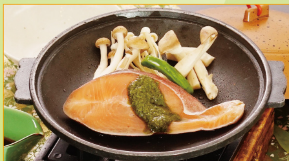
バジル醤油陶板焼き 1,000円