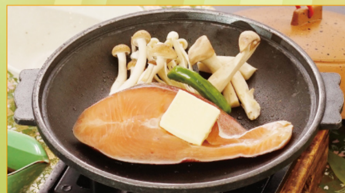
バター醤油陶板焼き 1,000円