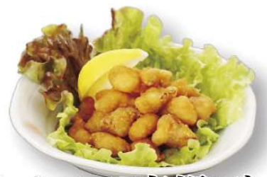
なんこつ唐揚げ 600円