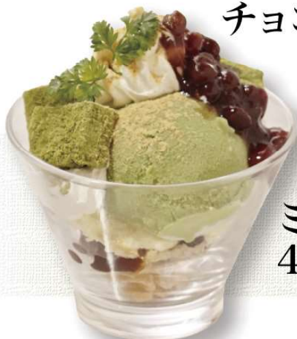
ミニ抹茶パフェ 430円