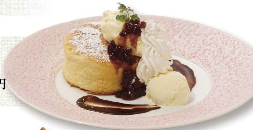
ふわふわパンケーキの バニラアイス添え 700円