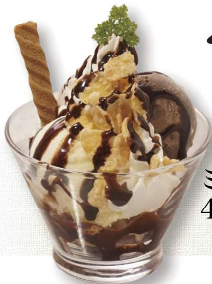
ミニチョコパフェ 400円