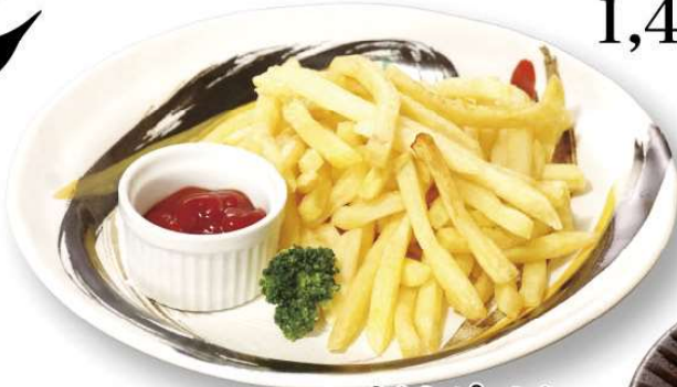
フライドポテト 400円