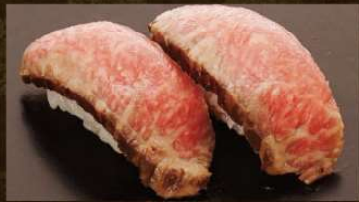
黒毛和牛ローストビーフ 490