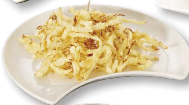
するめの天ぷら 480円