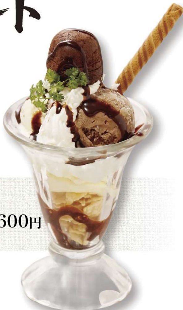
ながさわの チョコレートパフェ 600円