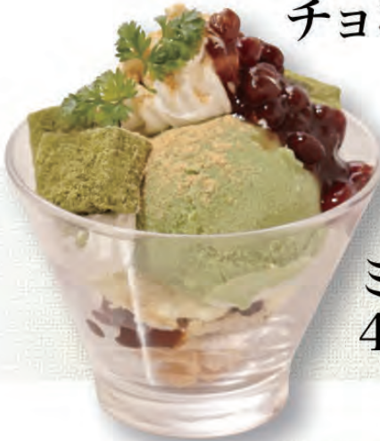
ミニ抹茶パフェ 430円