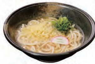
ハイカラうどん +530円