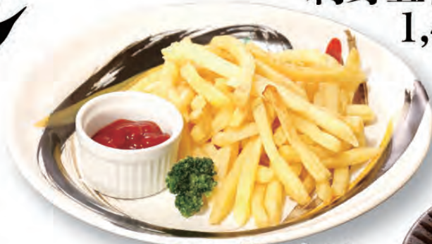
フライドポテト 400円