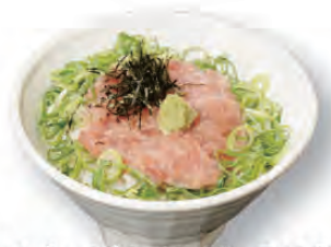
ミニねぎとろ丼 580円