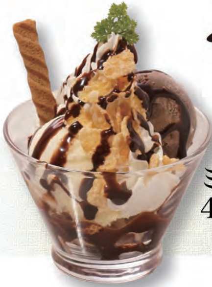
ミニチョコパフェ 400円