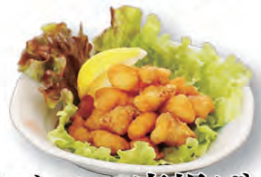
なんこつ唐揚げ 600円