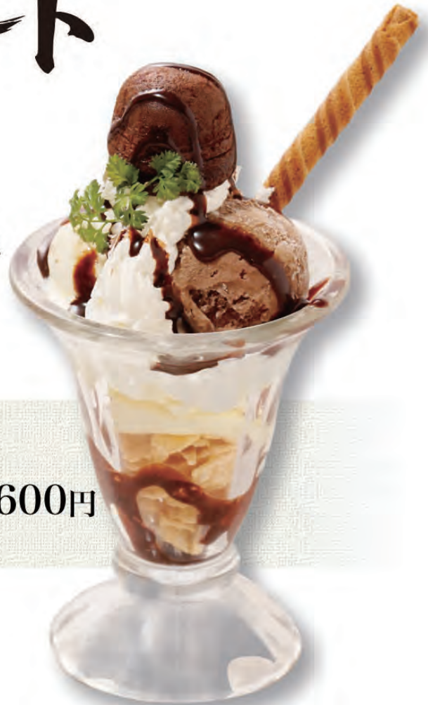
ながさわの チョコレートパフェ 600円