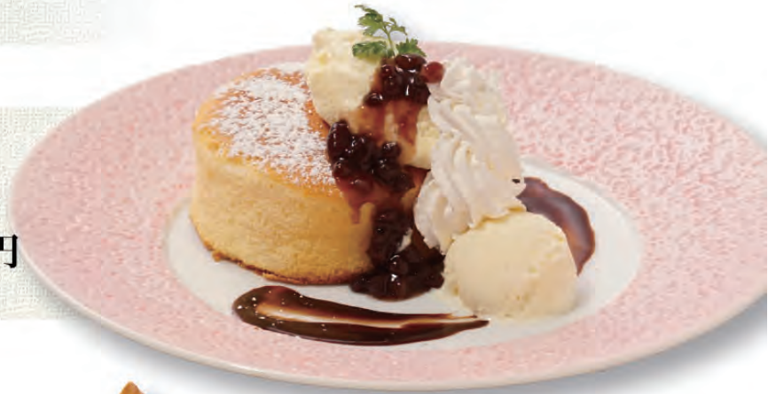
ふわふわパンケーキの バニラアイス添え 700円