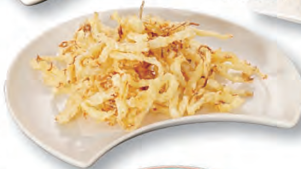
するめの天ぷら 480円