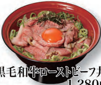
黒毛和牛ローストビーフ丼 1,280円