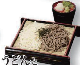
うどんと そばの相盛り 600円