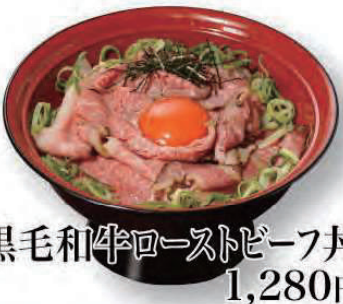
黒毛和牛ローストビーフ丼 1,280円