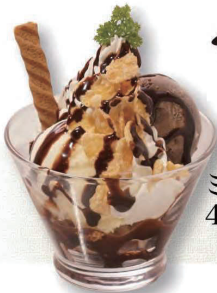
ミニチョコパフェ 400円