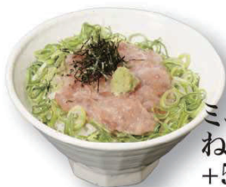
ミニ ねぎとろ丼 +500円

うどん(そば)と、以下の丼・にぎり寿司を組み合わせてご注文いただくと若干お得です!