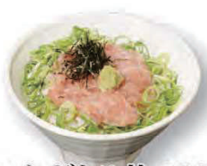
ミニねぎとろ丼 580円