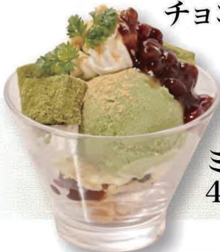
ミニ抹茶パフェ 430円