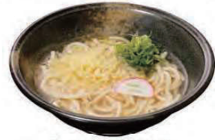
ハイカラうどん +530円