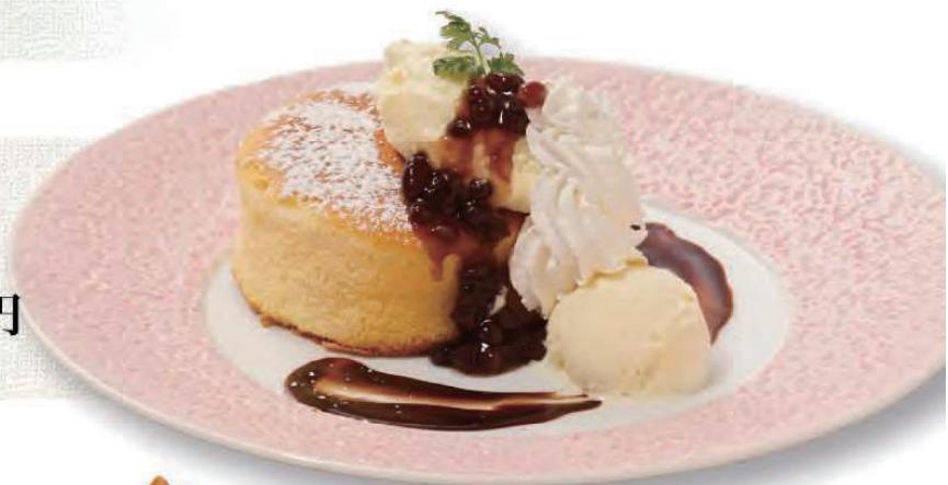
ふわふわパンケーキの バニラアイス添え 700円