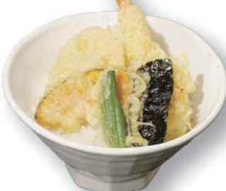
ミニ 天丼 +500円