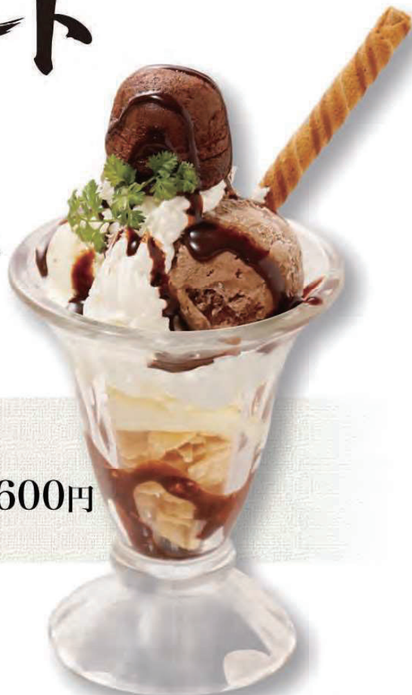
ながさわの チョコレートパフェ 600円