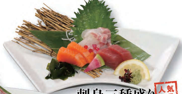
刺身三種盛り 人気商品 930円