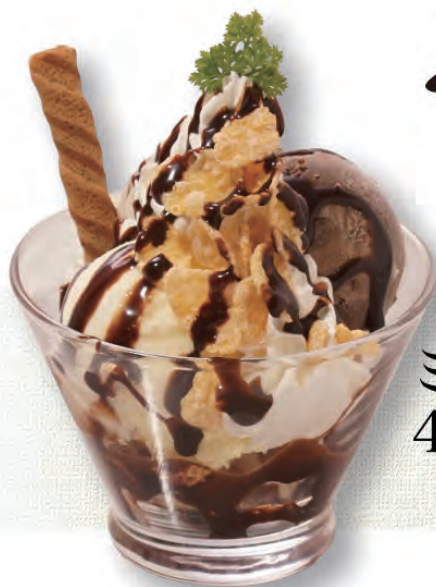
ミニチョコパフェ 400円