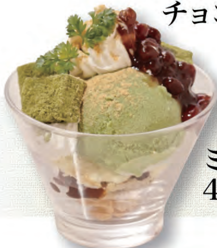
ミニ抹茶パフェ 430円