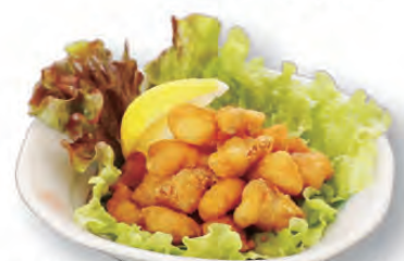
なんこつ唐揚げ 600円