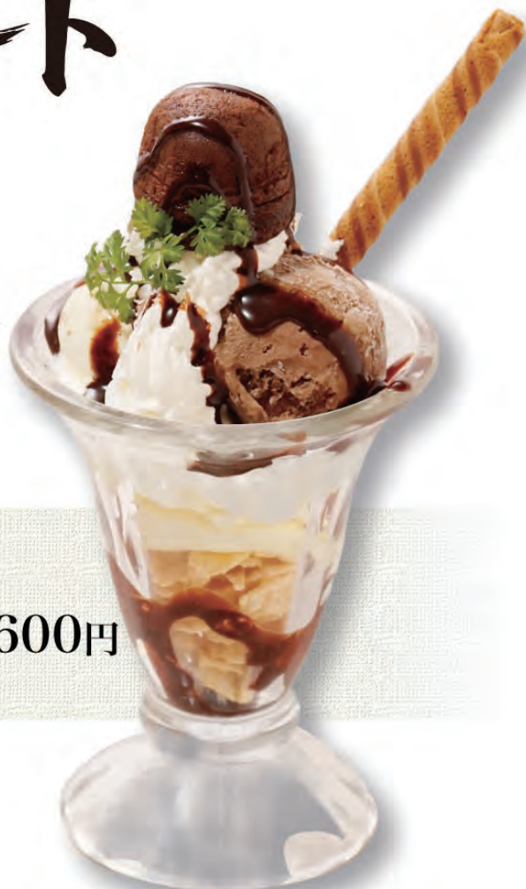
ながさわの チョコレートパフェ 600円