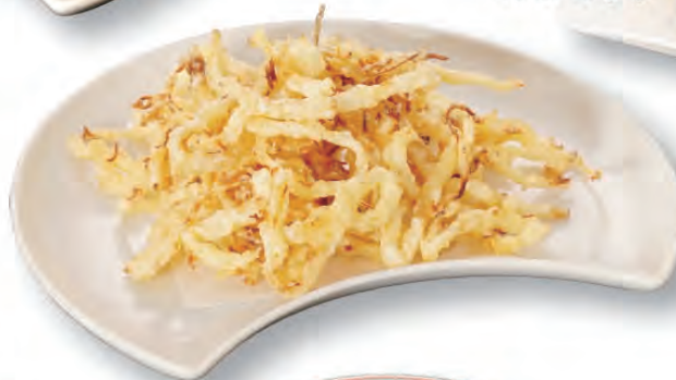
するめの天ぷら 480円