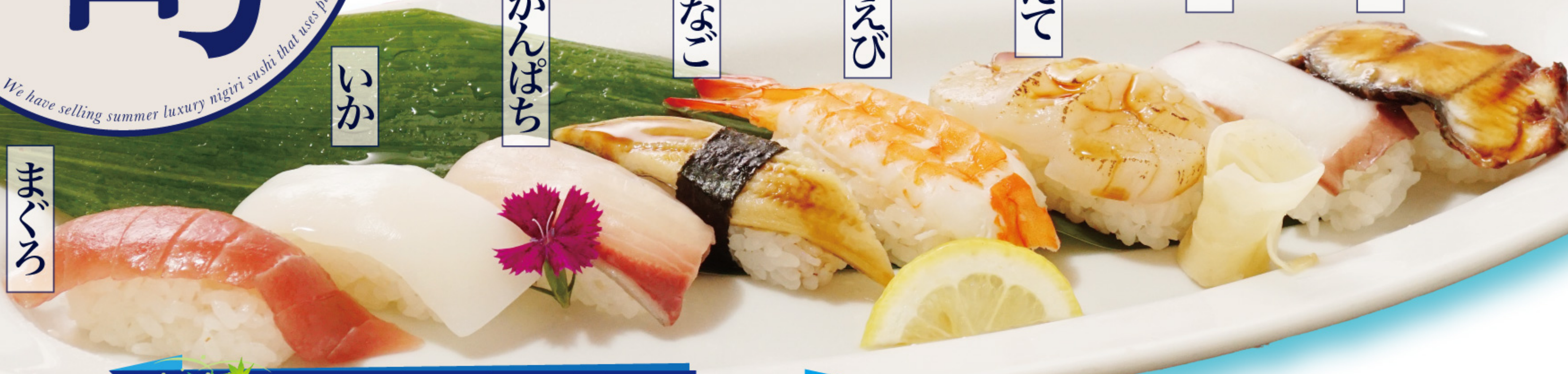
夏の涼にぎり8貫盛り 1,380円