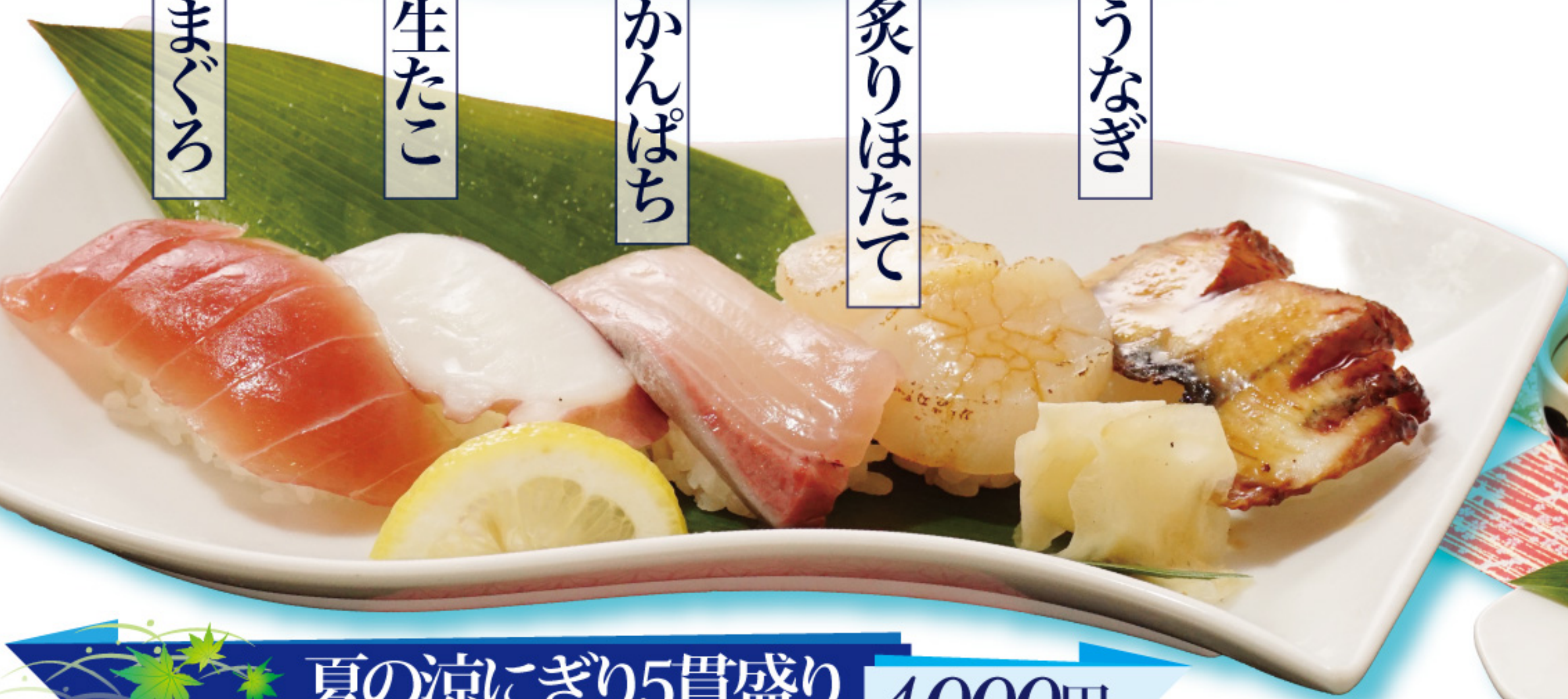
夏の涼にぎり5貫盛り 1,000円