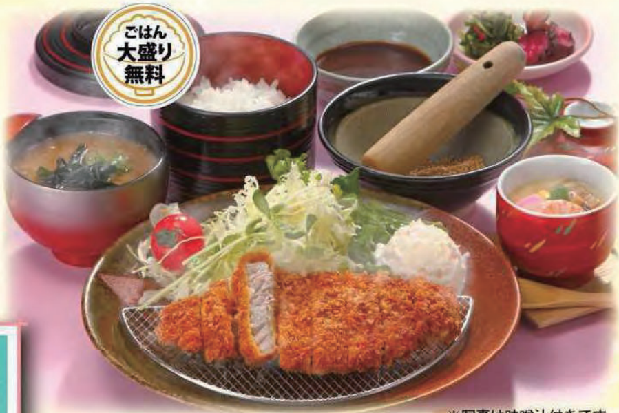
※写真は味噌汁付きです。