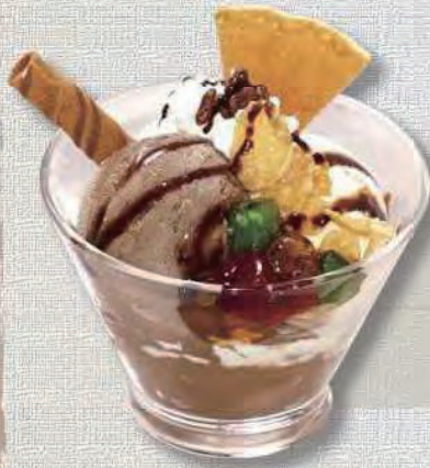
ミニチョコパフェ 400円