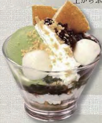
ミニ抹茶パフェ 430円

生クリームとフレーク、バニラとチョコのアイスの 上からふんだんにチョコレートソースをかけました