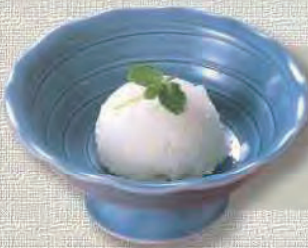
ゆず シャーベット