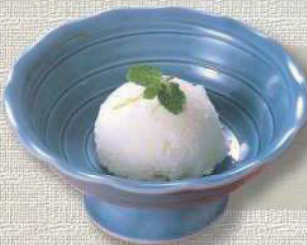
ゆず シャーベット