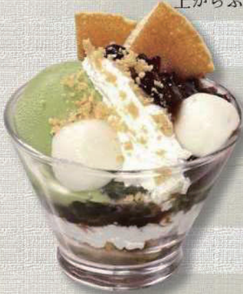
ミニ抹茶パフェ 430円

生クリームとフレーク、バニラとチョコのアイスの 上からふんだんにチョコレートソースをかけました