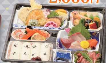
味みやび<白飯> 3,500円 (税込)