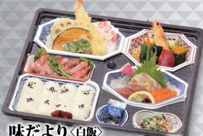
味だより<白飯> 2,500円 (税込)