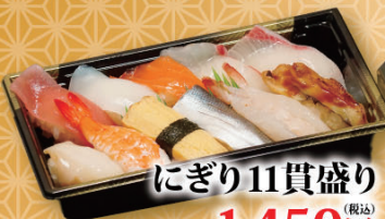
にぎり11貫盛り (税込) 1,450円