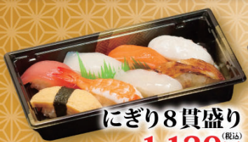
にぎり8貫盛り (税込) 1,130円