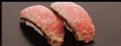
神戸ビーフのローストビーフ 380