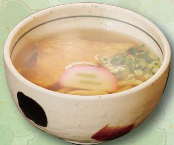
ミニきつねうどん 340円