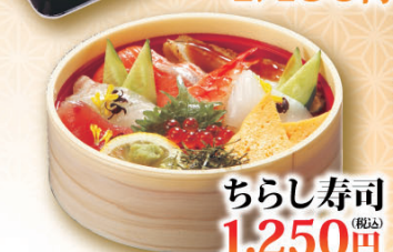
ちらし寿司 (税込) 1,250円