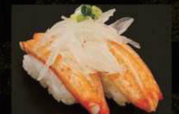
かにかま Mayo 190