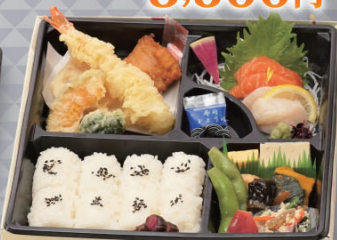
味いちもんめ<白飯> 1,600円 (税込)