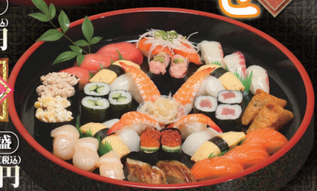
だんらん 3~4人盛 5,200円 (税込)