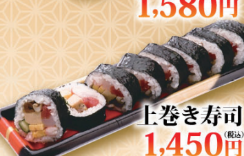
上巻き寿司 (税込) 1,450円