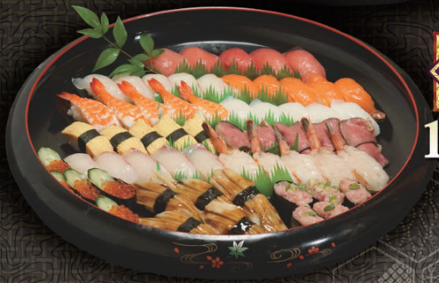
にぎわい 5人盛 11,200円 (税込) 4人盛 8,960円 (税込) 3人盛 6,720円 (税込) 2人盛 4,480円 (税込) 1人盛 2,240円 (税込)