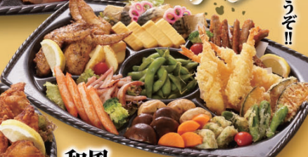
和風 オードブル 5,800円 (税込)