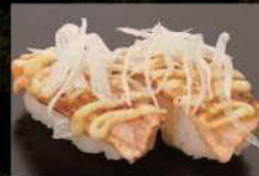
炙りサーモンマヨ 380