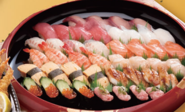
松セット 寿司4~5人前 +オードブル 12,800円 (税込)