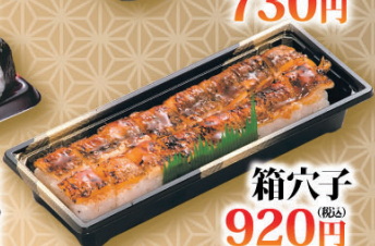
箱穴子 (税込) 920円