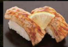
炙りサーモンたれ 380