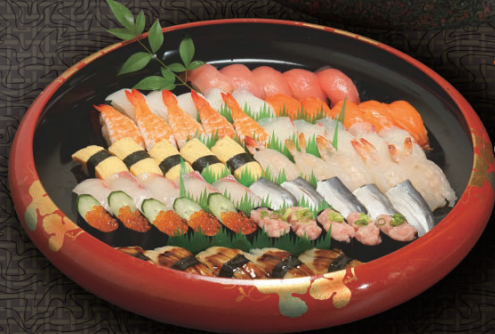
つどい 5人盛 8,950円 (税込) 4人盛 7,160円 (税込) 3人盛 5,370円 (税込) 2人盛 3,580円 (税込) 1人盛 1,790円 (税込)