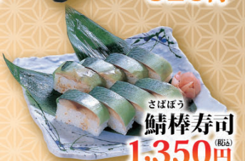
さばぼう 鯖棒寿司 (税込) 1,350円