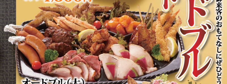
オードブル(大) 7,000円 (税込)