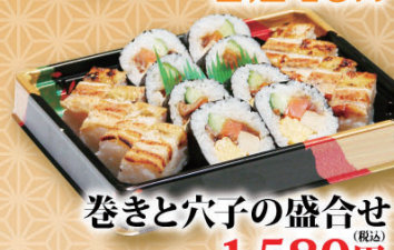
巻きと穴子の盛合せ (税込) 1,580円