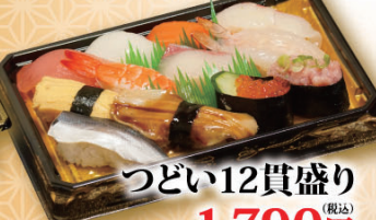
つどい12貫盛り (税込) 1,790円