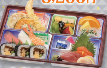
味ごよみ<にぎり・巻き> 2,500円 (税込)