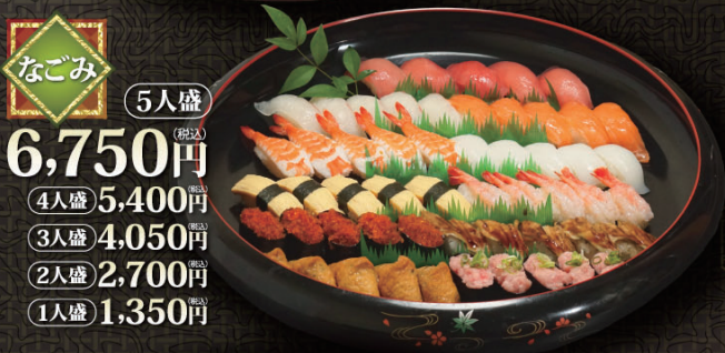
なごみ 5人盛 6,750円 (税込) 4人盛 5,400円 (税込) 3人盛 4,050円 (税込) 2人盛 2,700円 (税込) 1人盛 1,350円 (税込)