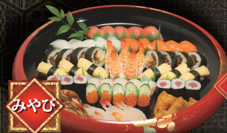
みやび 4~5人盛 7,900円 (税込)