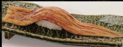
煮あなご一本勝負 580