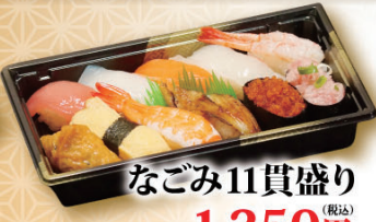
なごみ11貫盛り (税込) 1,350円