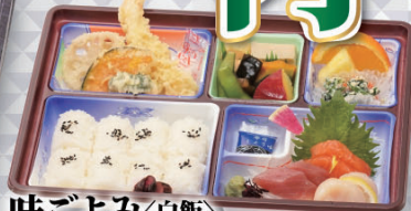
味ごよみ<白飯> 2,000円 (税込)