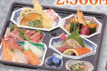
味だより<にぎり寿司> 3,200円 (税込)