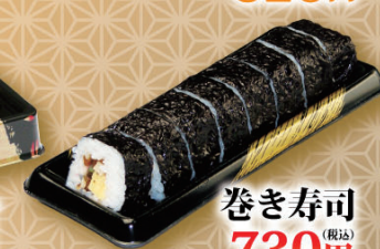
巻き寿司 (税込) 730円