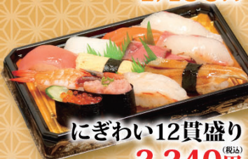
にぎわい12貫盛り (税込) 2,240円