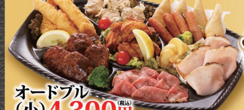
オードブル (小) 4,300円 (税込)