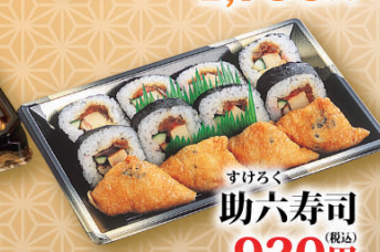
すけろく 助六寿司 (税込) 920円