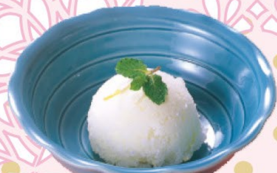
ゆずシャーベット 164円 (税込 180円)