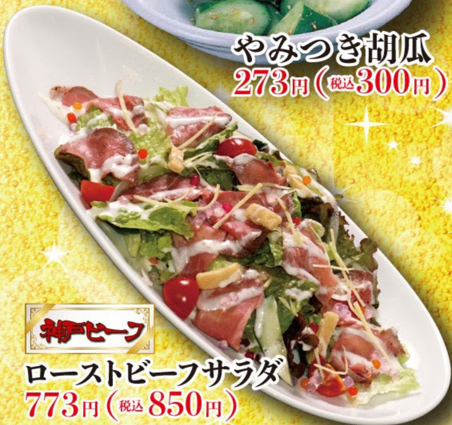
神戸ビーフ ローストビーフサラダ 773円 (税込 850円)