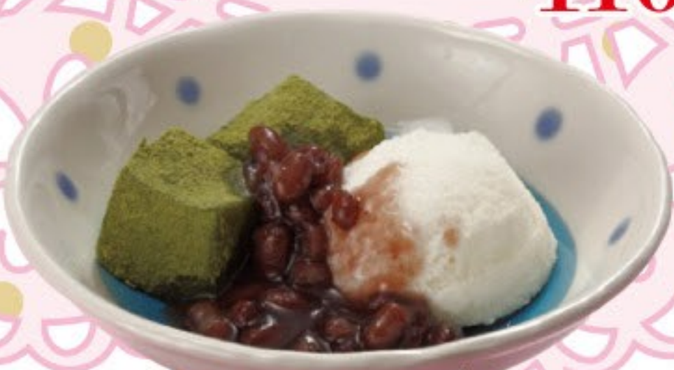
抹茶わらびと バニラアイス 228円 (税込 250円)