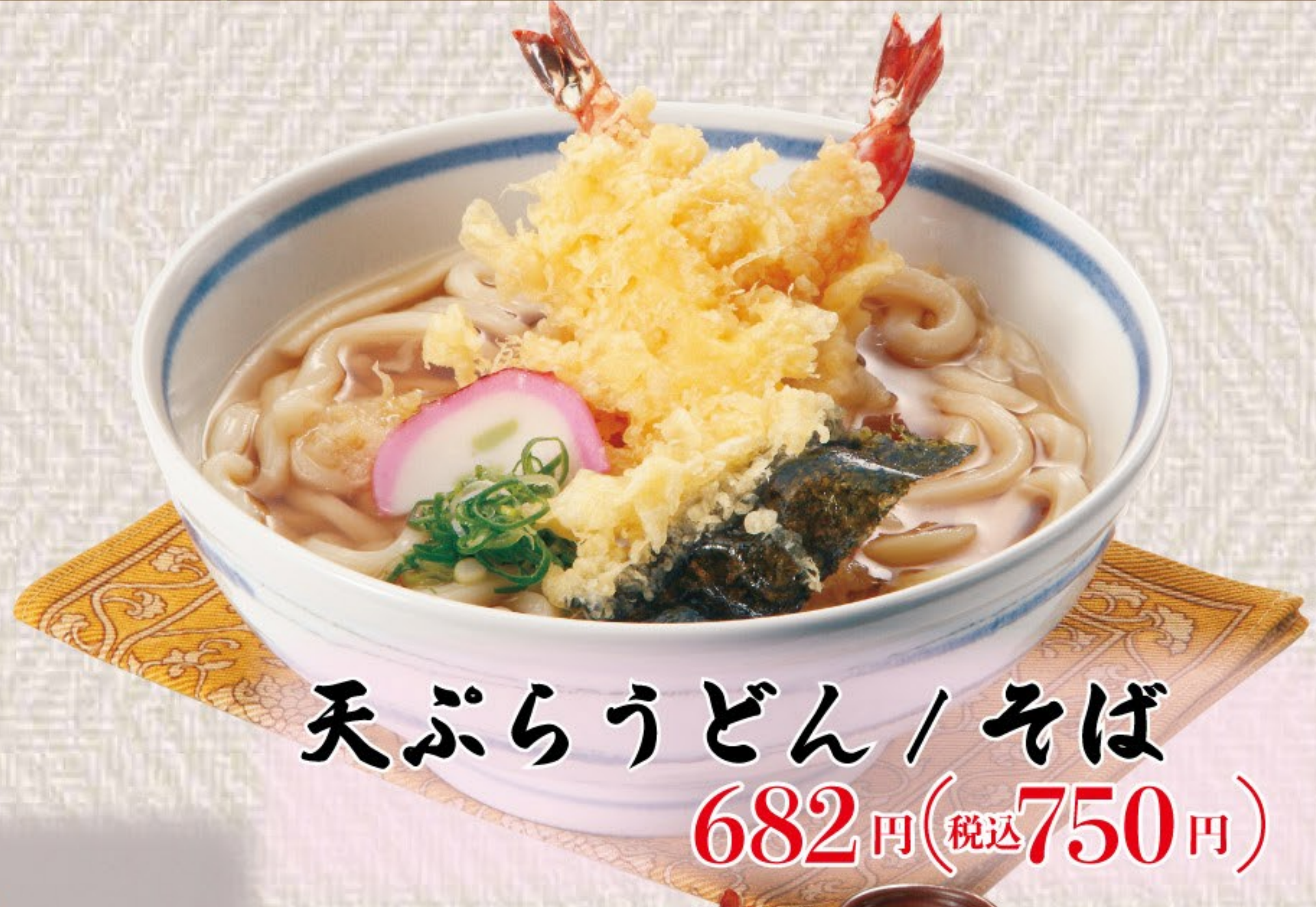
天ぷらうどん / そば 682円(税込750円)