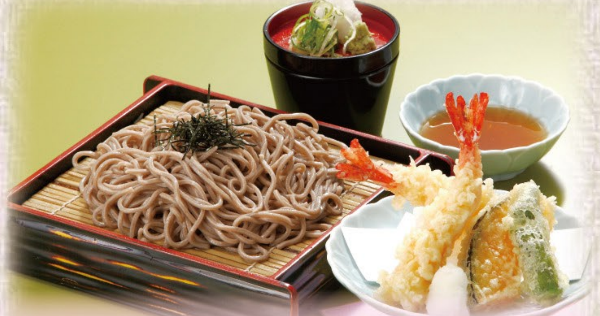
天ざるそば / うどん 955円(税込1,050円)