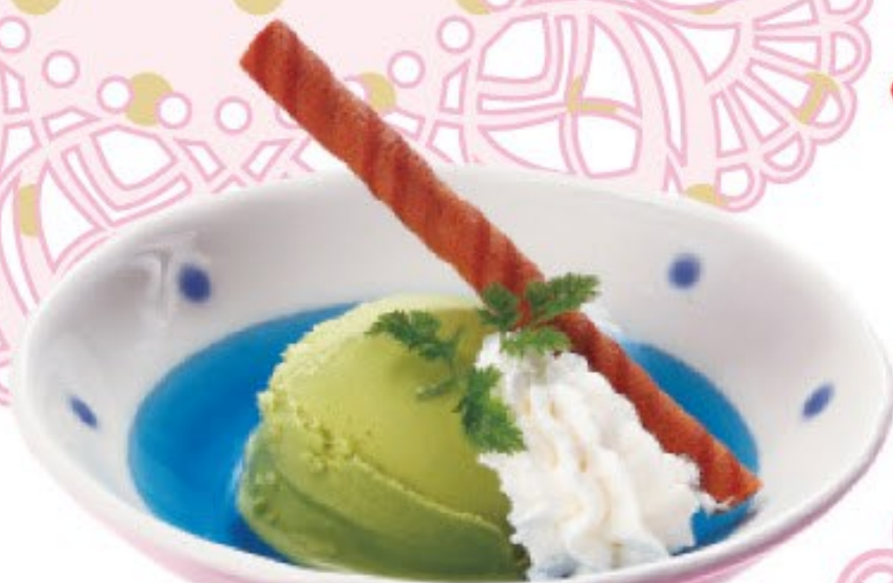
抹茶アイス 164円 (税込 180円)