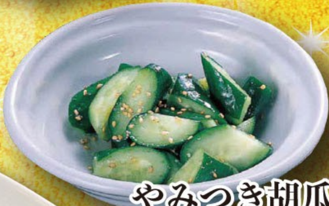
やみつき胡瓜 273円 (税込 300円)