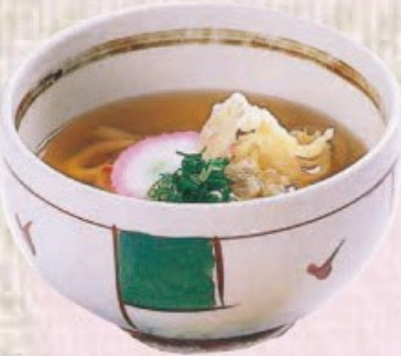
ミニうどん / そば 310円(税込340円)