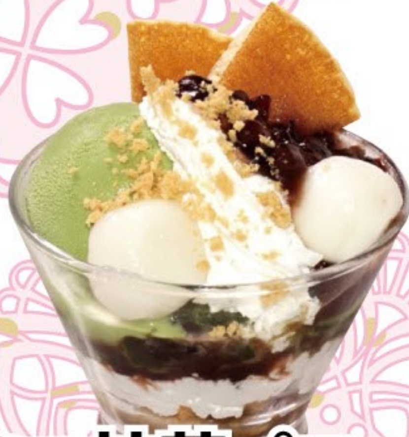
ミニ抹茶パフェ 337円 (税込 370円)