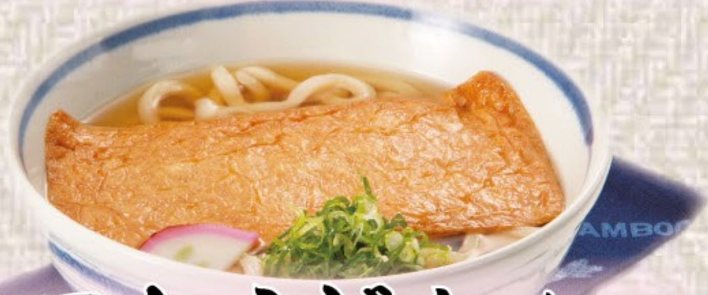
きつねうどん / たぬきそば 528円(税込580円)