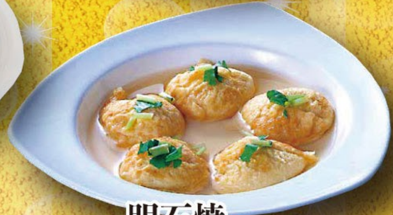
明石焼 546円 (税込 600円)