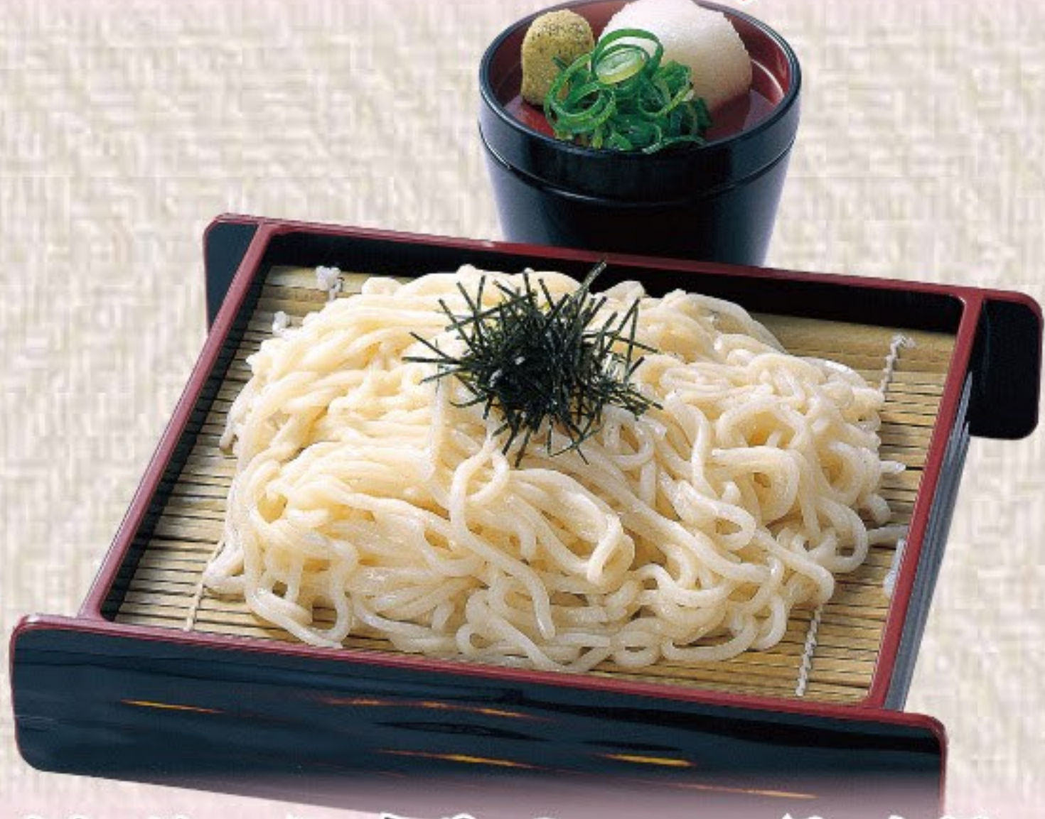
ざるうどん / そば 528円(税込580円)