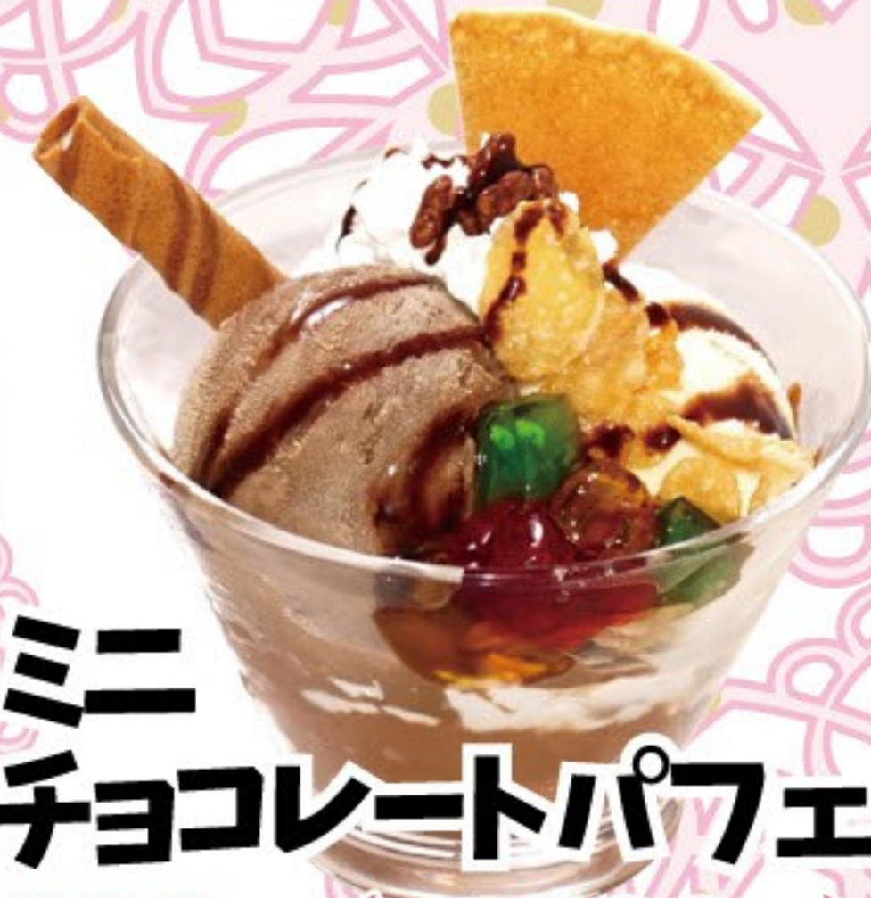
ミニ チョコレートパフェ 300円 (税込 330円)