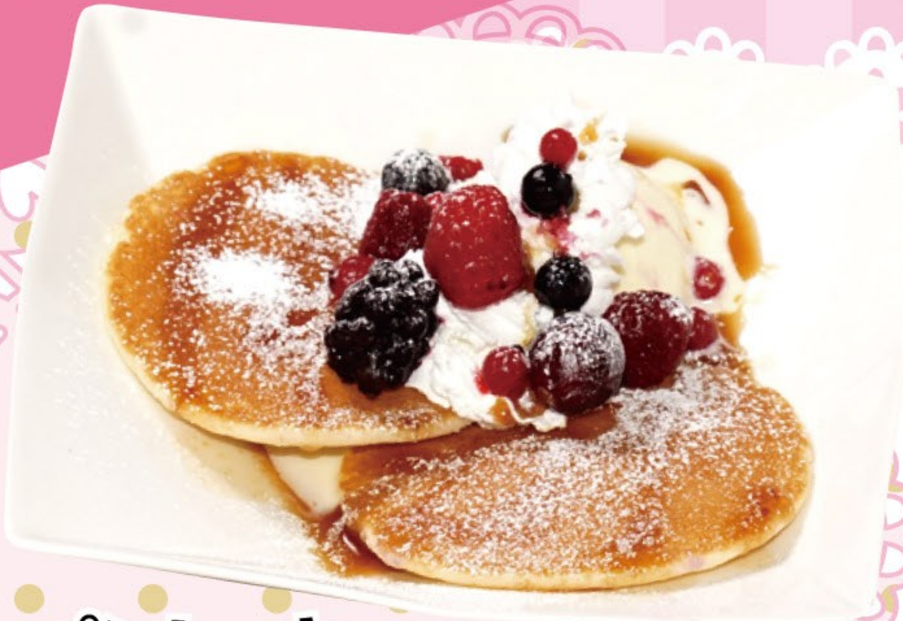
パンケーキ バニラアイス添え 410円 (税込 450円)