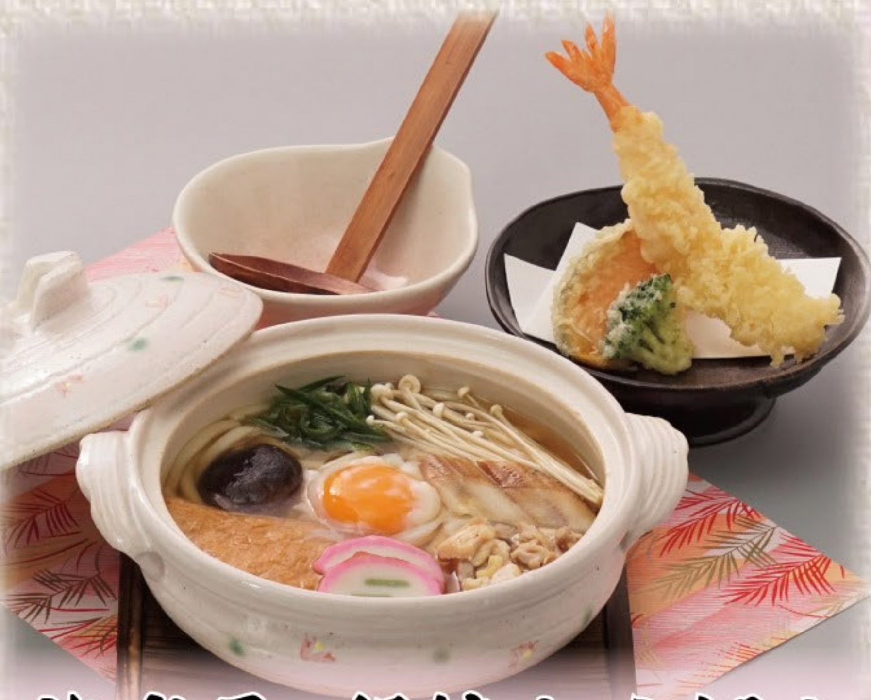
海老天 鍋焼きうどん 982円(税込1,080円)