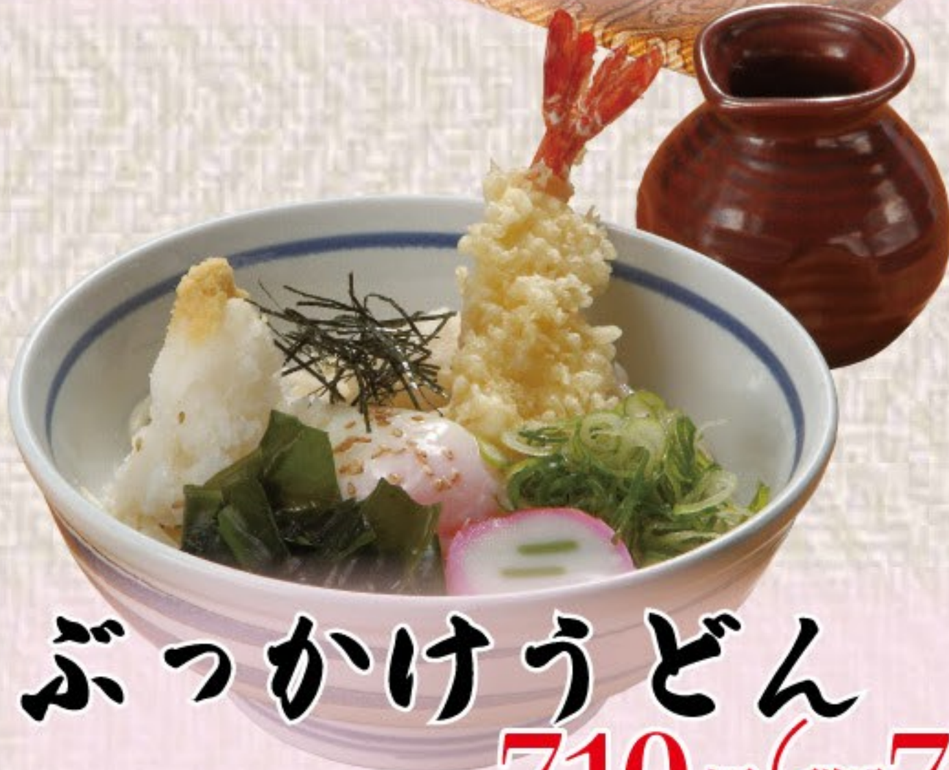
ぶっかけうどん 710円(税込780円)