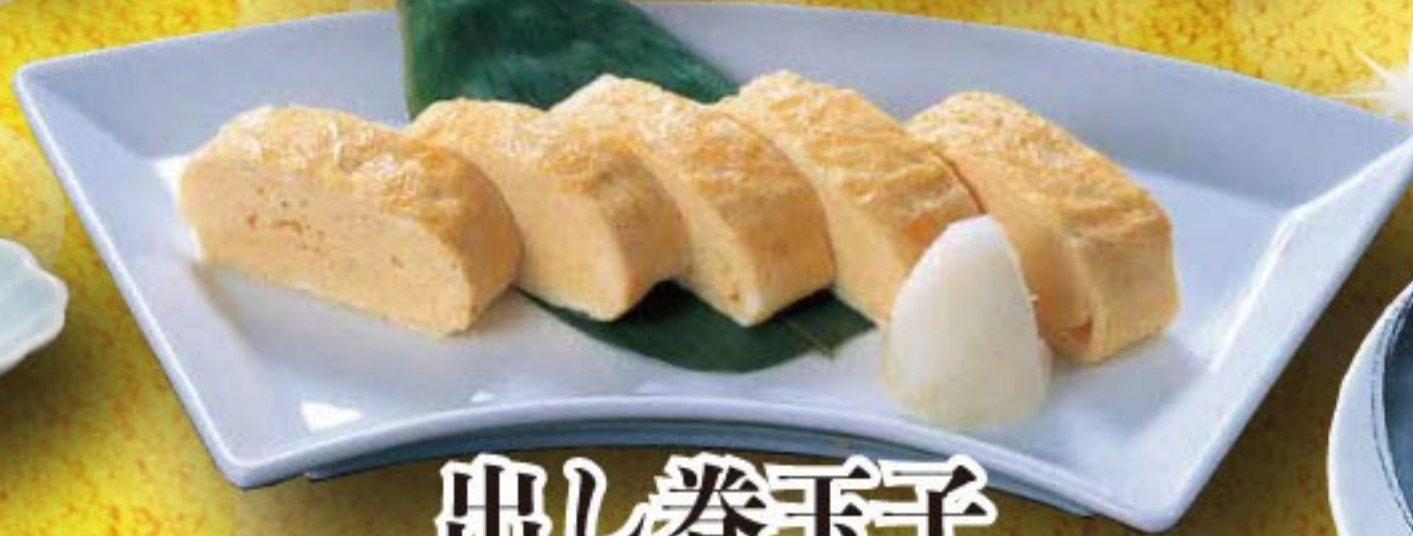
出し巻玉子 500円 (税込 550円)