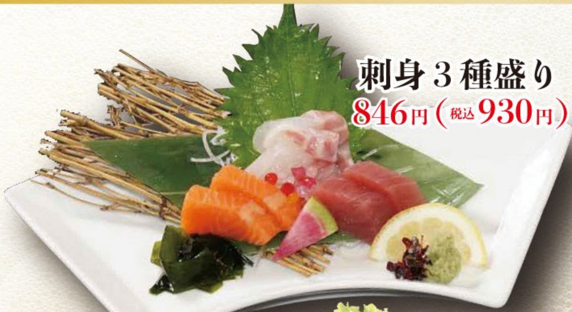
刺身 3種盛り 846円 (税込 930円)