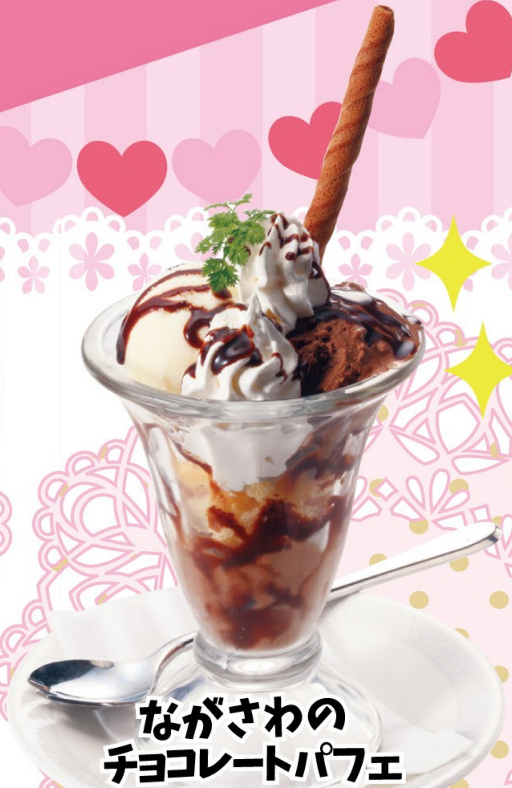
ながさわの チョコレートパフェ 528円 (税込 580円)