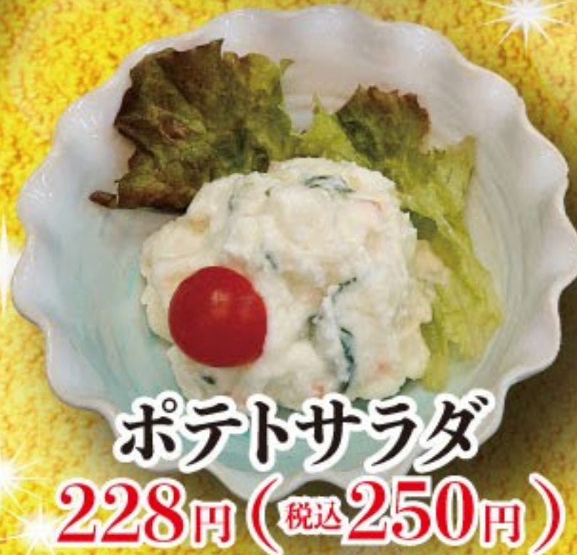
ポテトサラダ 228円 (税込 250円)