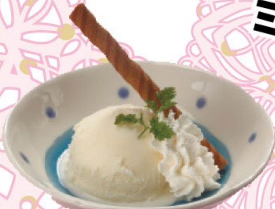
バニラアイス 164円 (税込 180円)