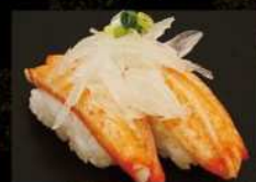
かにかま Mayo 190