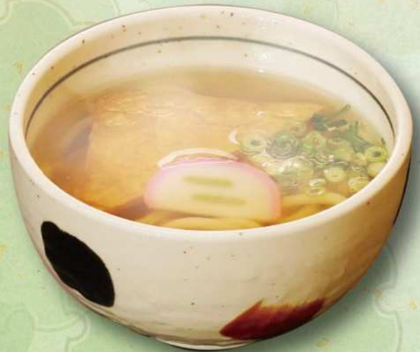
ミニきつねうどん 340円