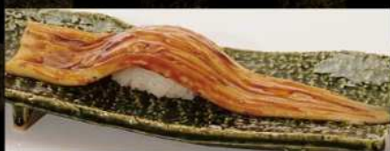
煮あなご一本勝負 580