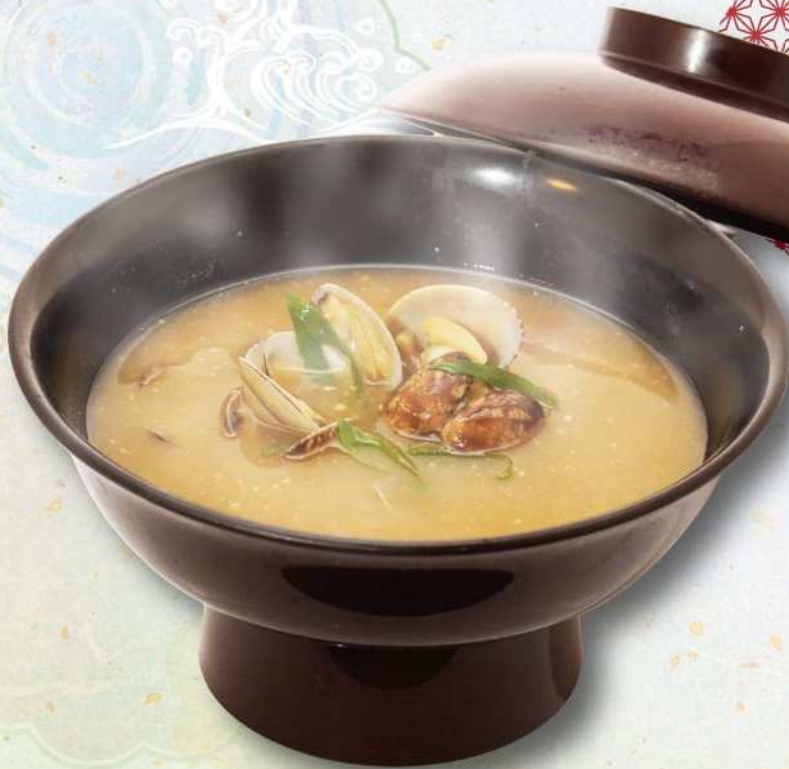
大漁あさり貝汁 450円