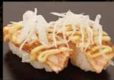
炙りサーモンマヨ 380