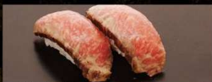
神戸ビーフのローストビーフ 380