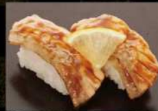
炙りサーモンたれ 380