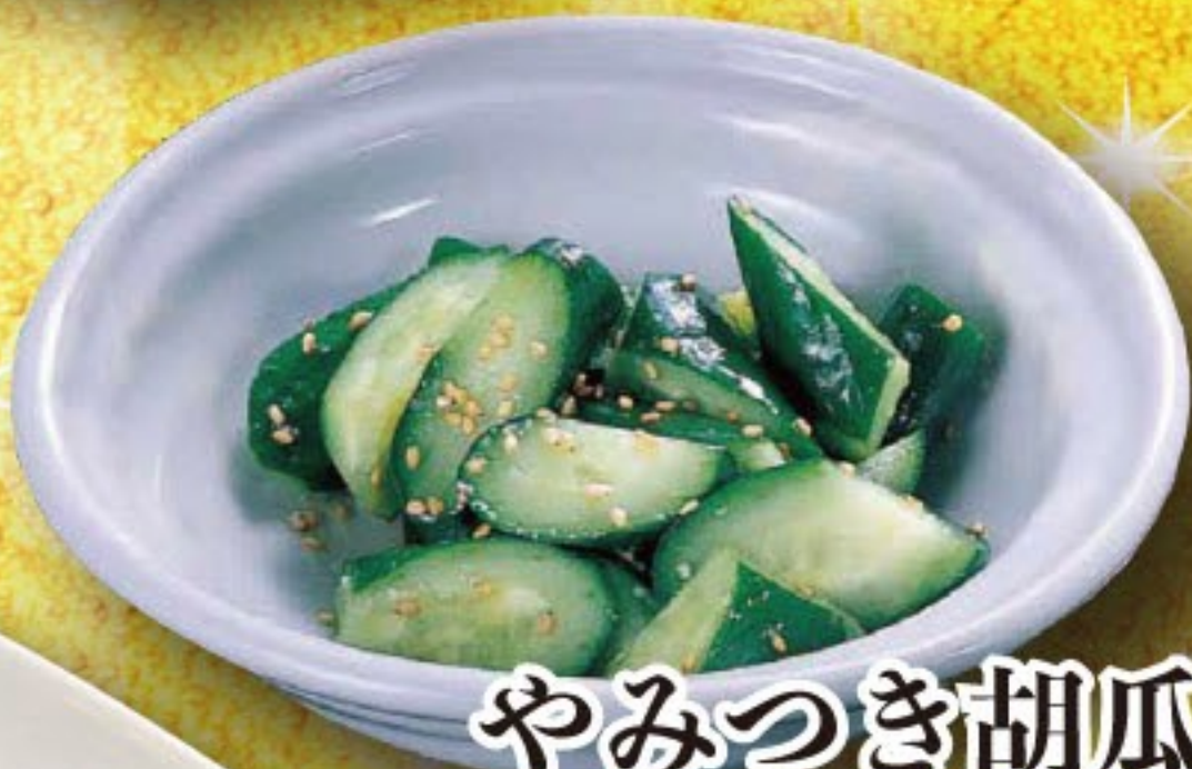
やみつき胡瓜 273円 (税込 300円)