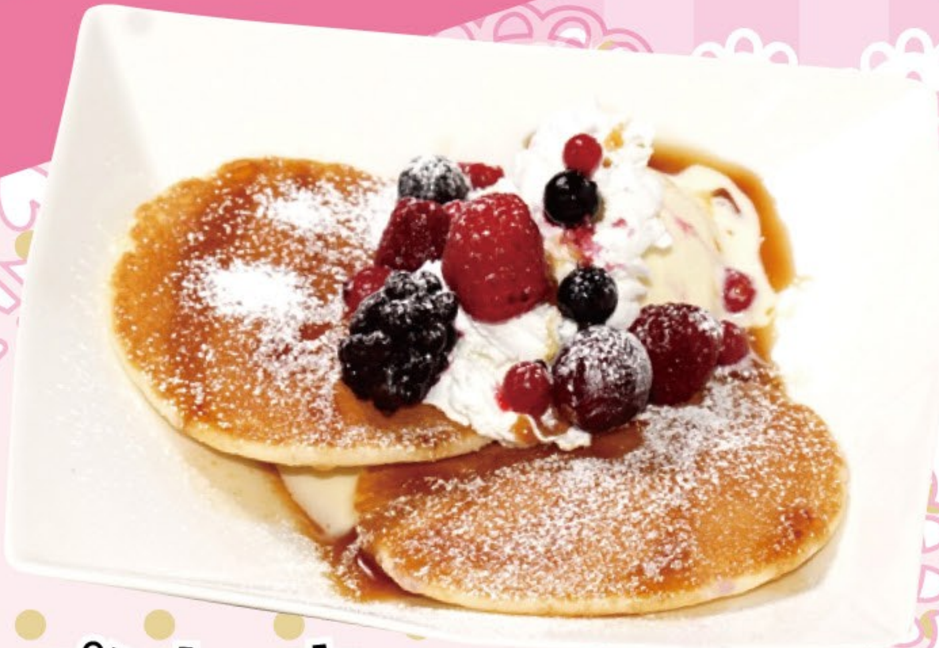
パンケーキ バニラアイス添え