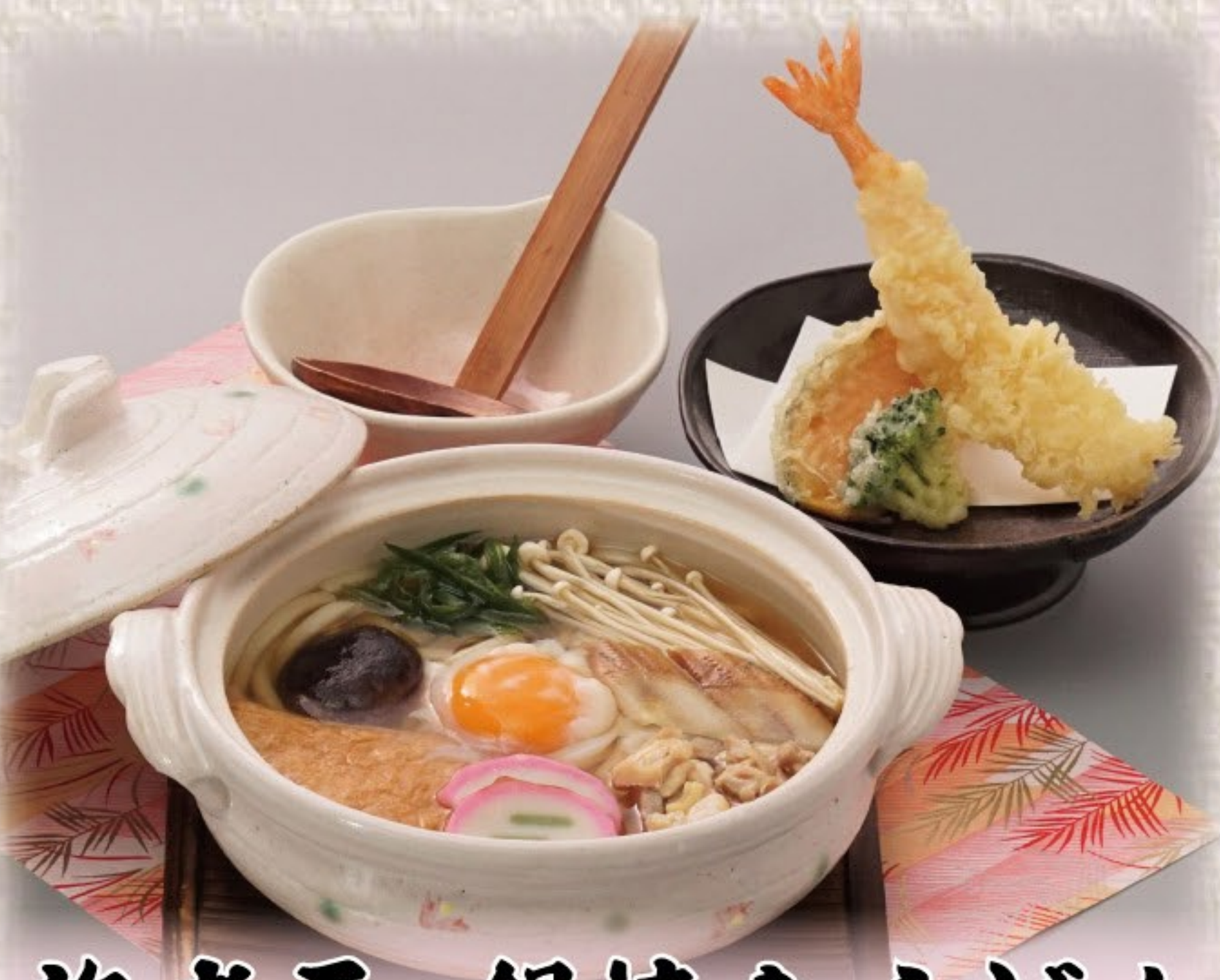
海老天 鍋焼きうどん 982円(税込1,080円)