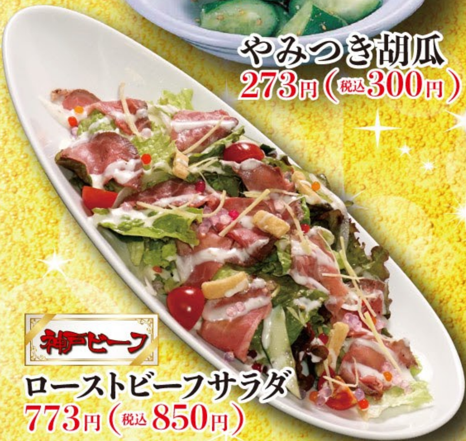
神戸ビーフ ローストビーフサラダ 773円 (税込 850円)