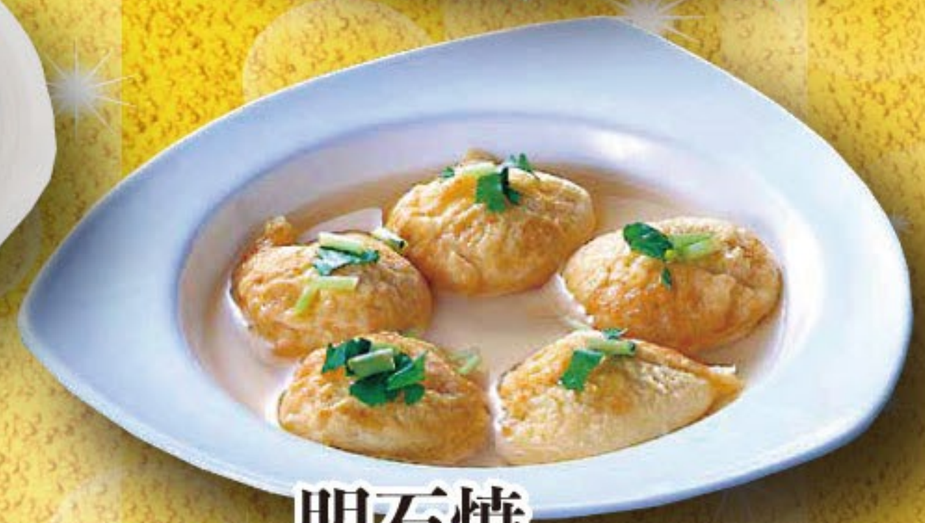
明石焼 546円 (税込 600円)