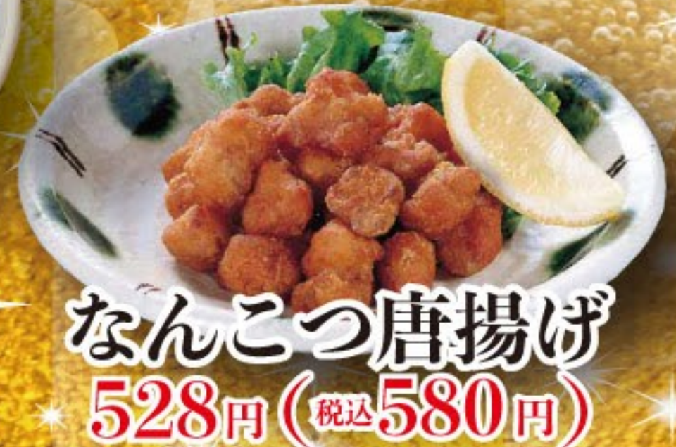
なんこつ唐揚げ 528円 (税込 580円)