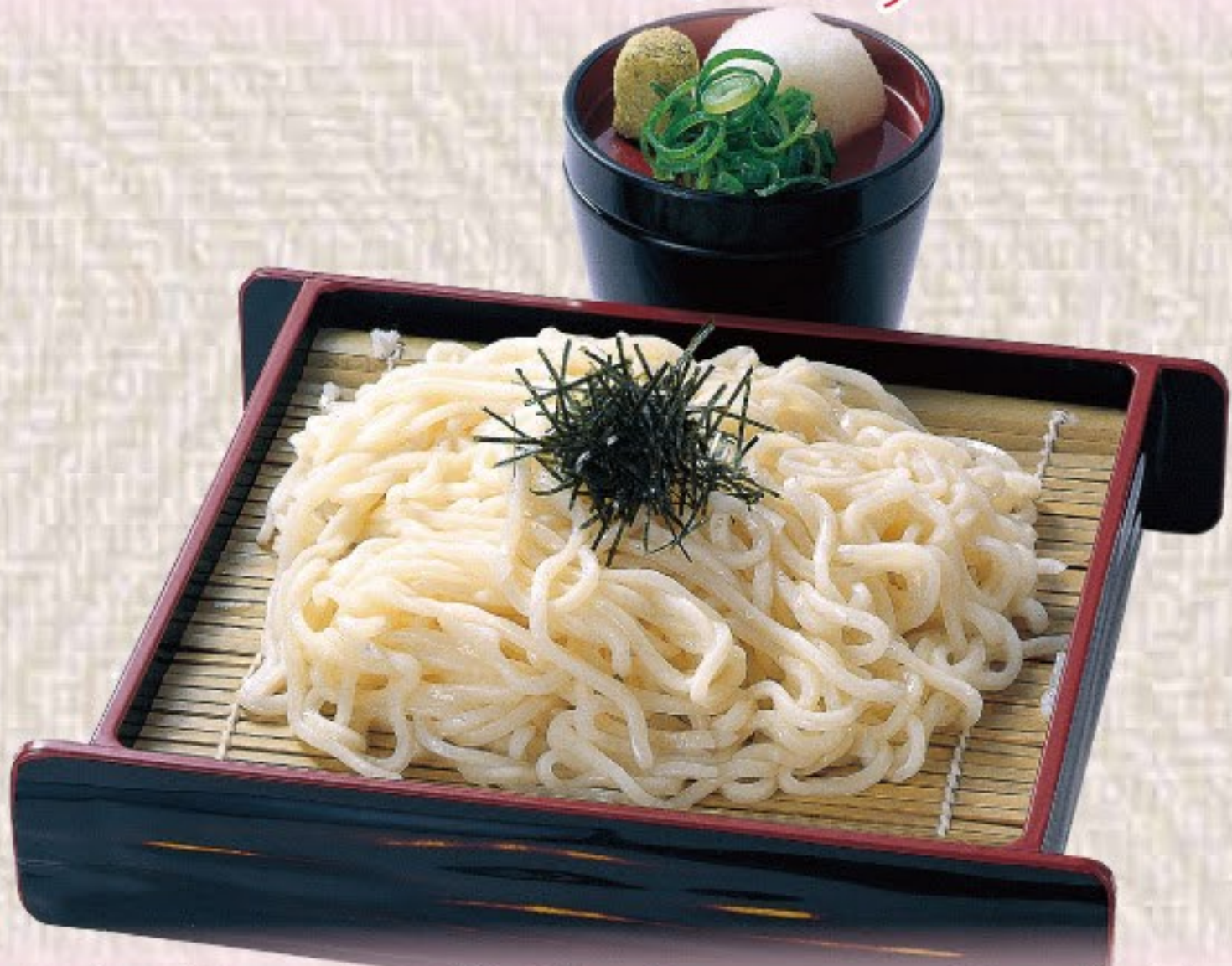
ざるうどん / そば 528円(税込580円)