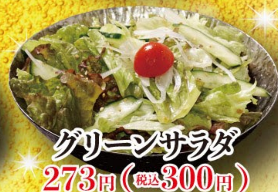
グリーンサラダ 273円 (税込 300円)