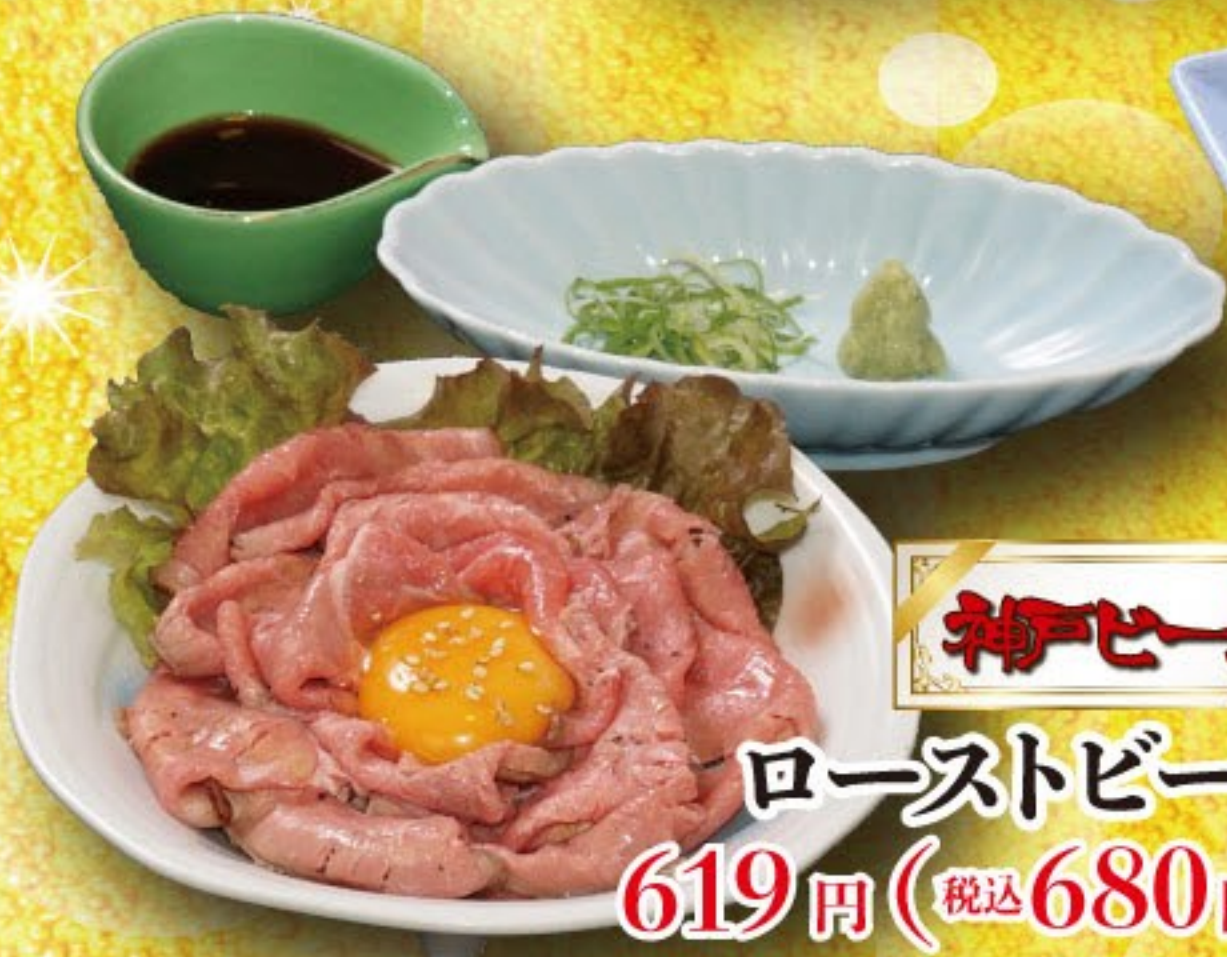
神戸ビーフ ローストビーフ 619円 (税込 680円)