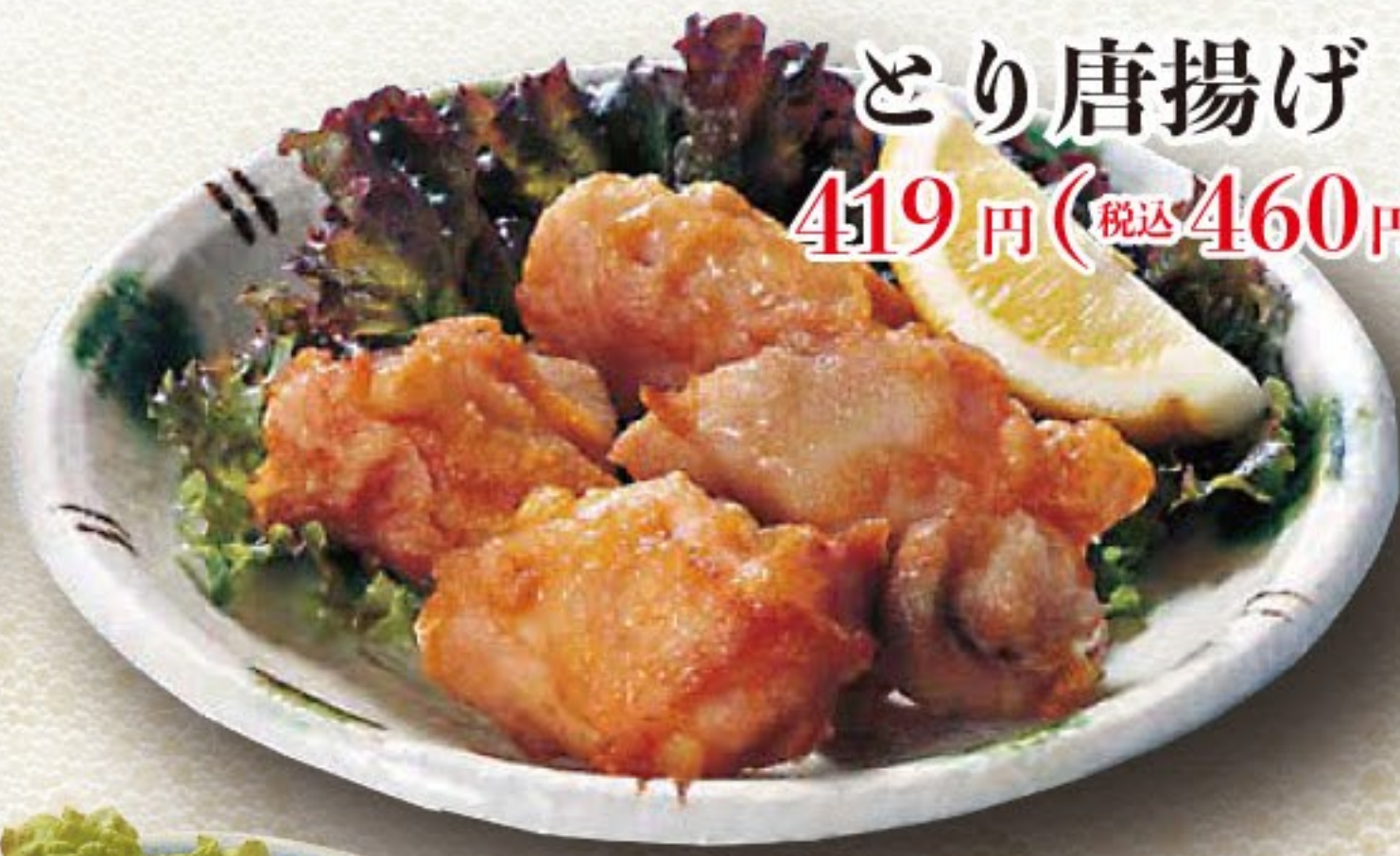
とり唐揚げ 419円 (税込 460円)