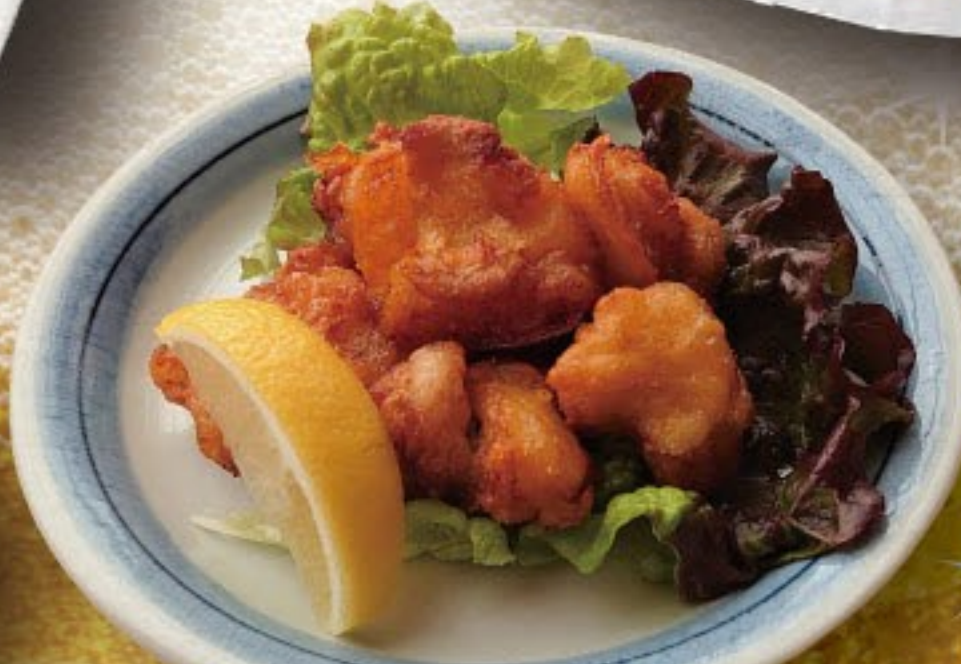
ホルモン唐揚げ 528円 (税込 580円)