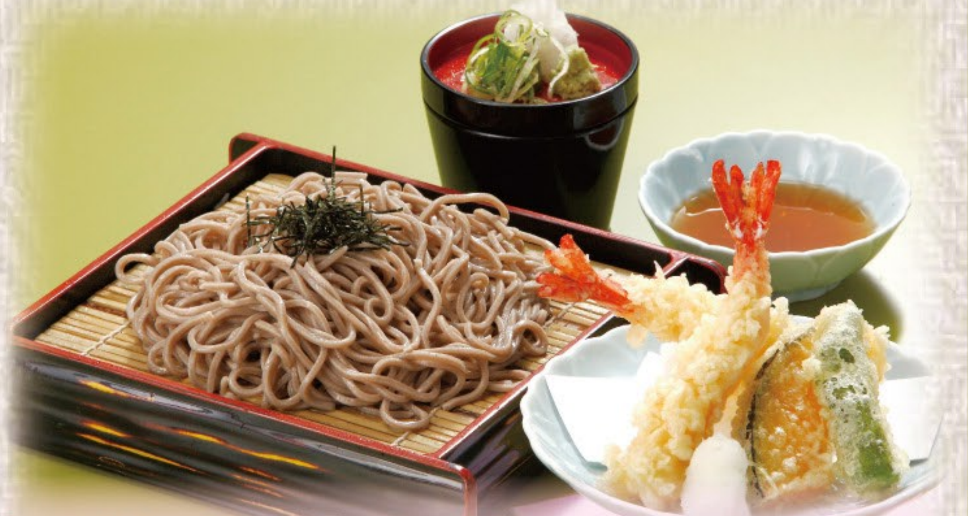
天ざるそば / うどん 955円(税込1,050円)