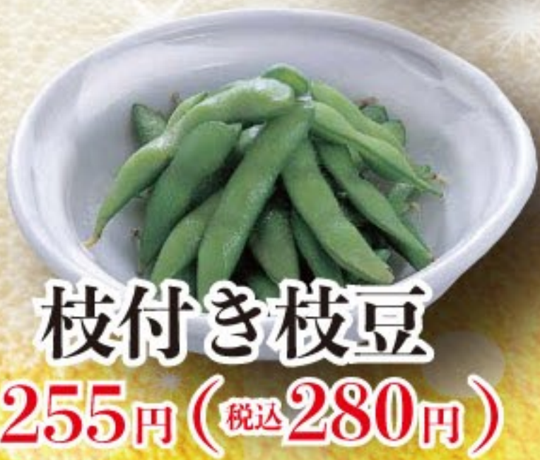
枝付き枝豆 255円 (税込 280円)