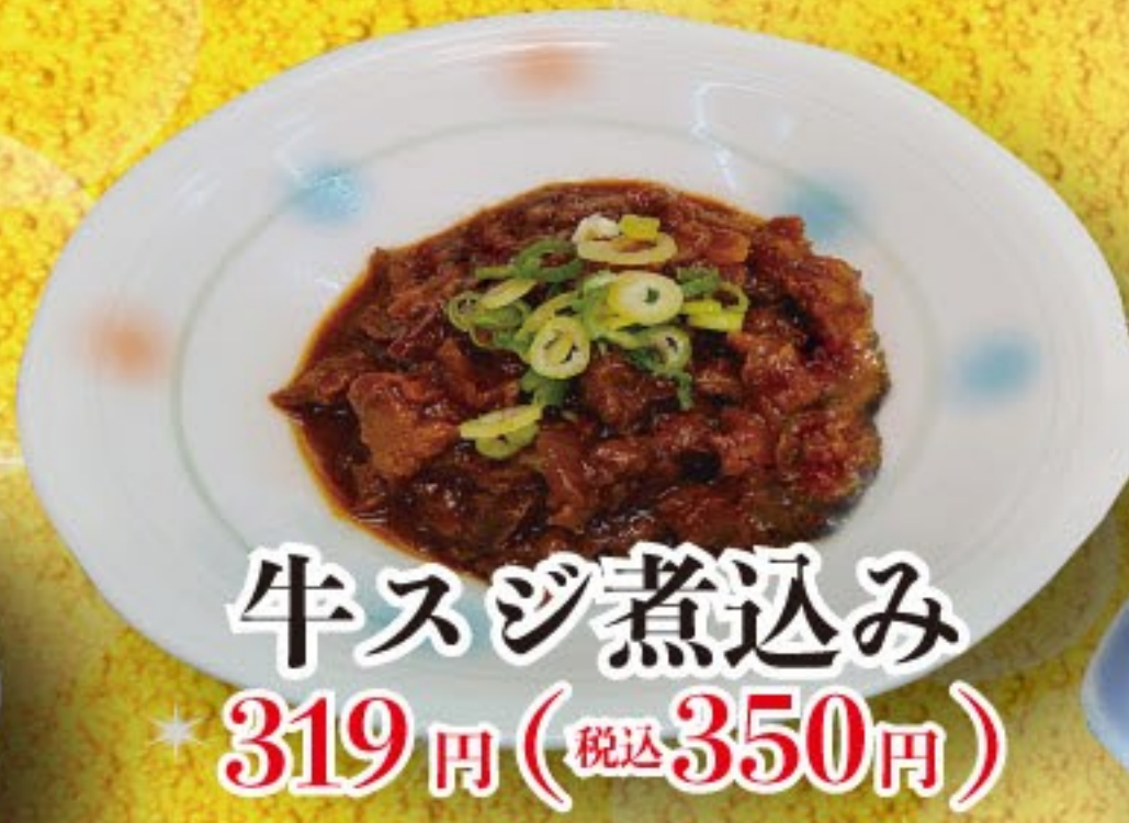
牛スジ煮込み 319円 (税込 350円)