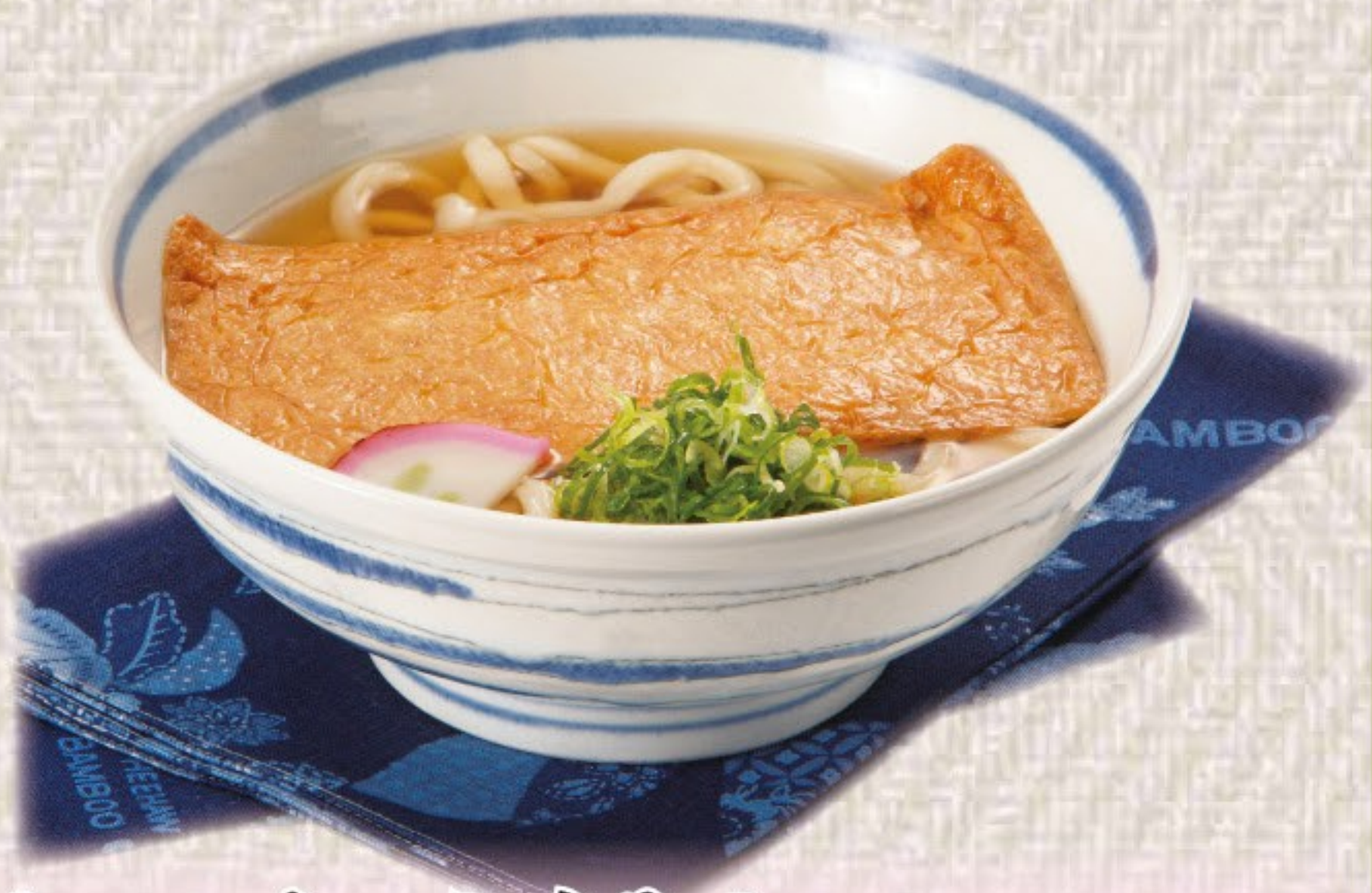
きつねうどん / たぬきそば 528円(税込580円)