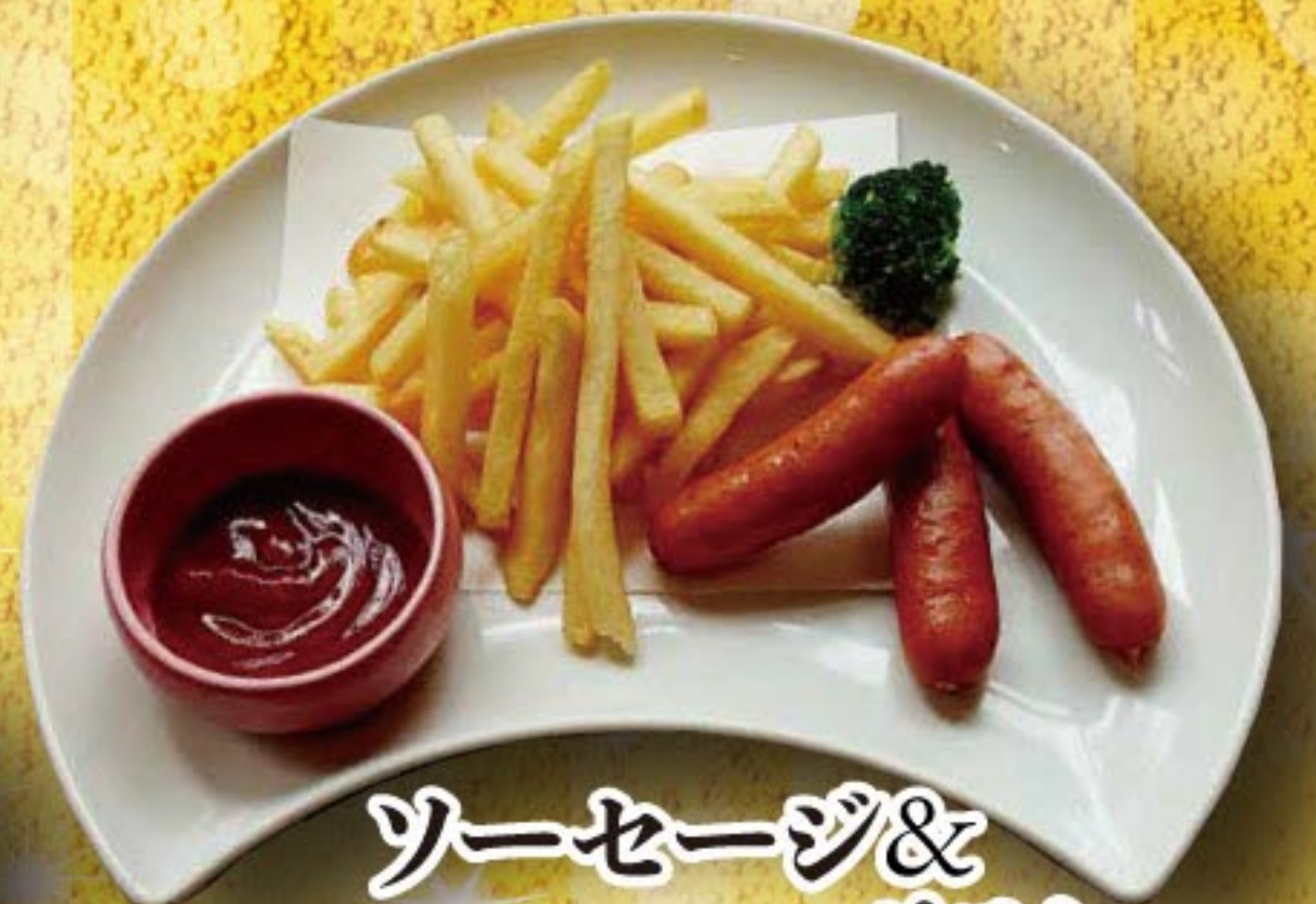
ソーセージ& ポテト 364円 (税込 400円)