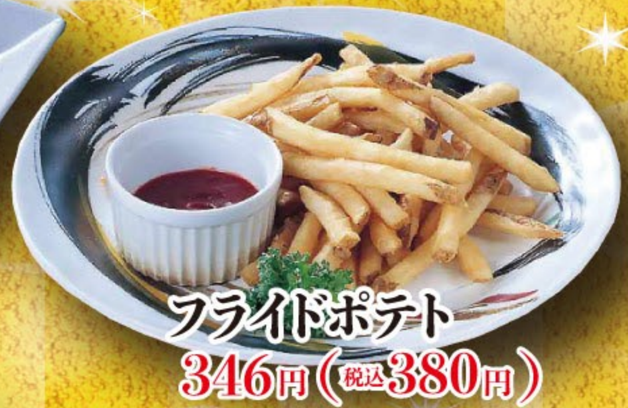
フライドポテト 346円 (税込 380円)