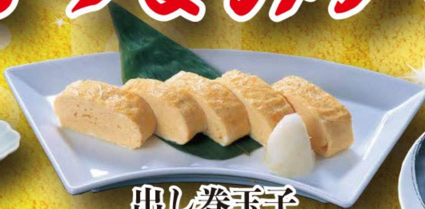
出し巻玉子 500円 (税込 550円)