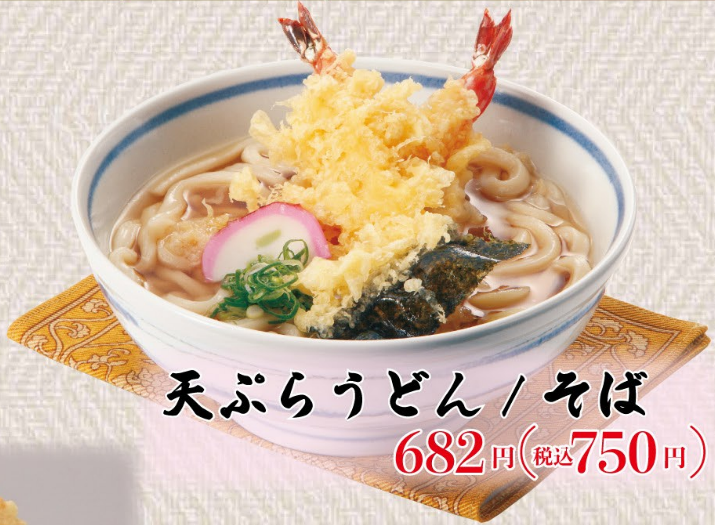
天ぷらうどん / そば 682円(税込750円)