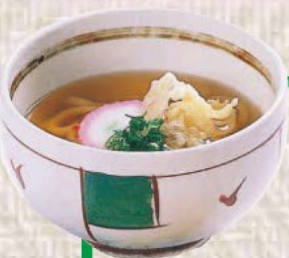
ミニうどん / そば 310円(税込340円)