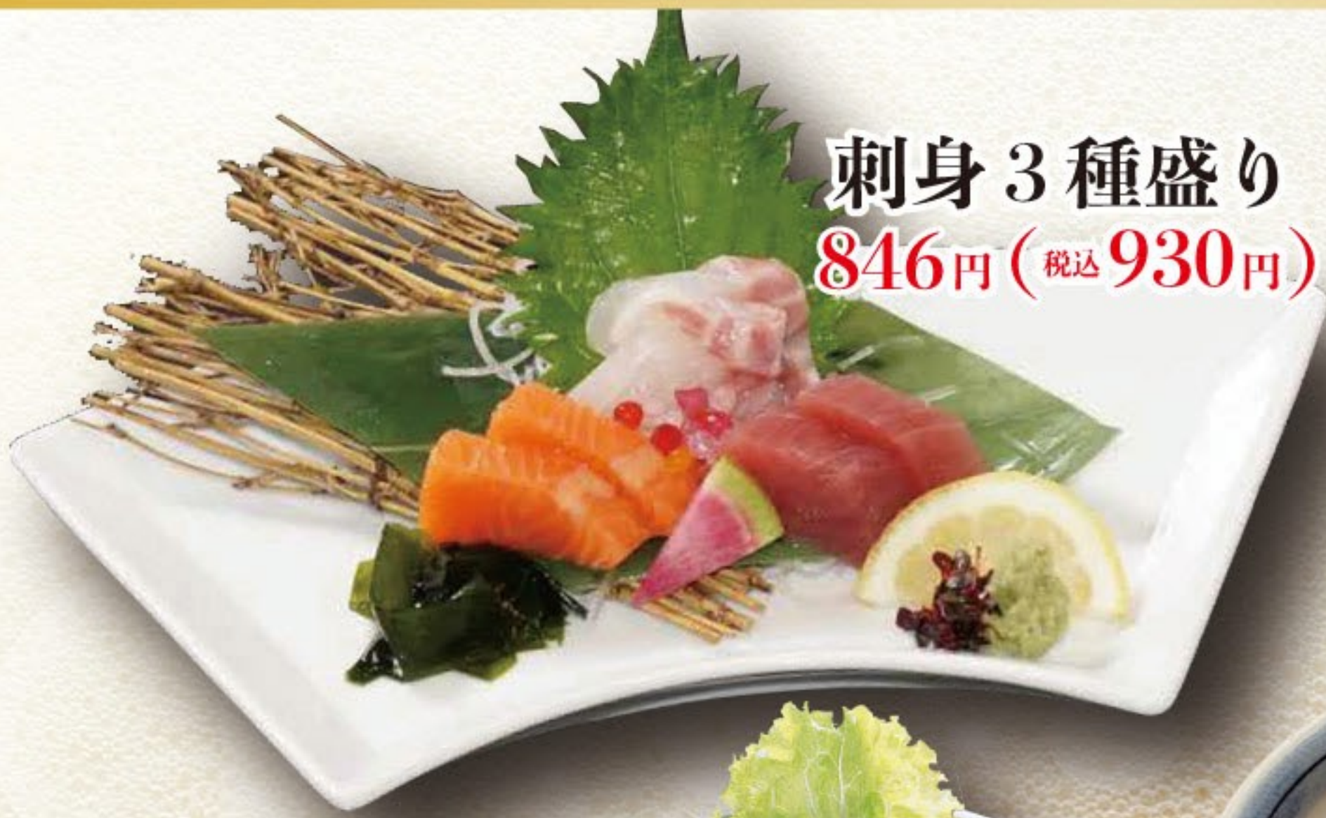
刺身 3種盛り 846円 (税込 930円)