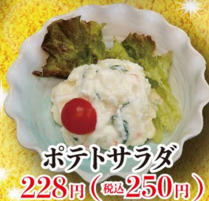
ポテトサラダ 228円 (税込 250円)