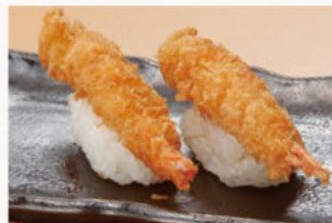
エビフライにぎり