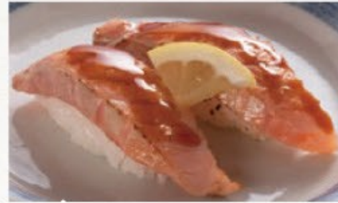
あぶりサーモンタレ