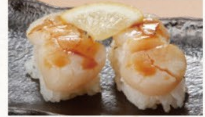
あぶりホタテタレ