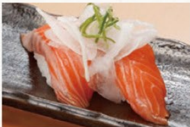
サーモンマヨネーズ