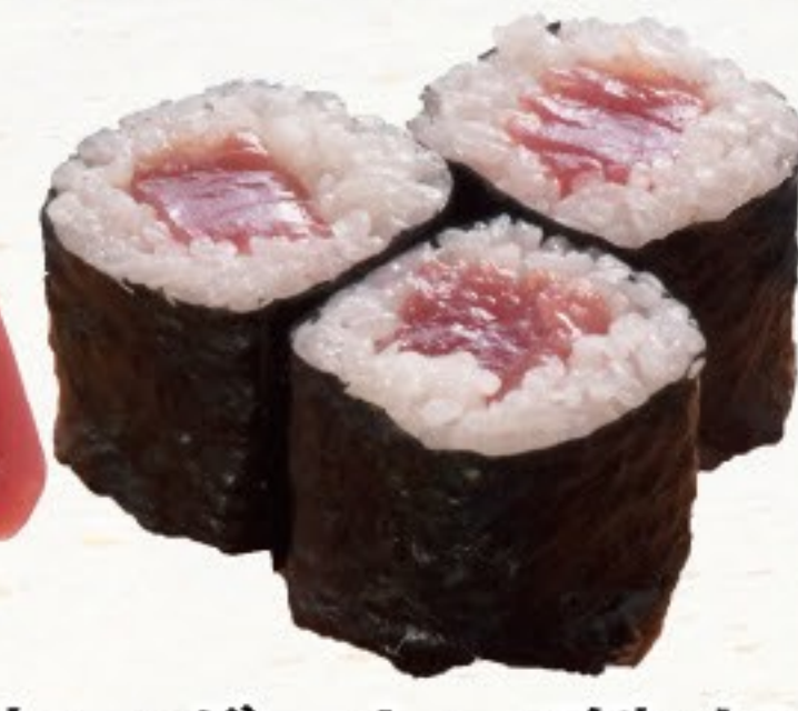
本マグロトロ(鉄火)