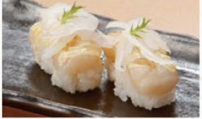
あぶりホタテマヨ